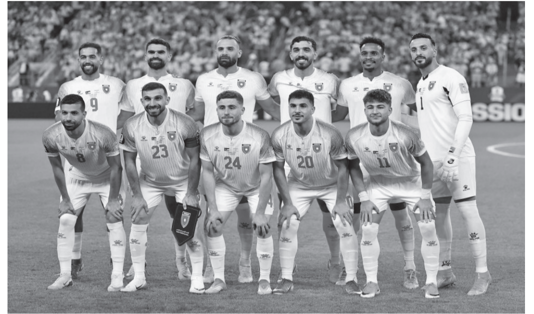
الأنباط - عمان حصل المنتخب الوطني لكرة القدم على مكافأة مالية تبلغ ٩ ملايين دولار بعد مشاركته في نهائيات كأس العالم ٢٠٢٦، وفق إعلان للاتحاد الدولي لكرة القدم