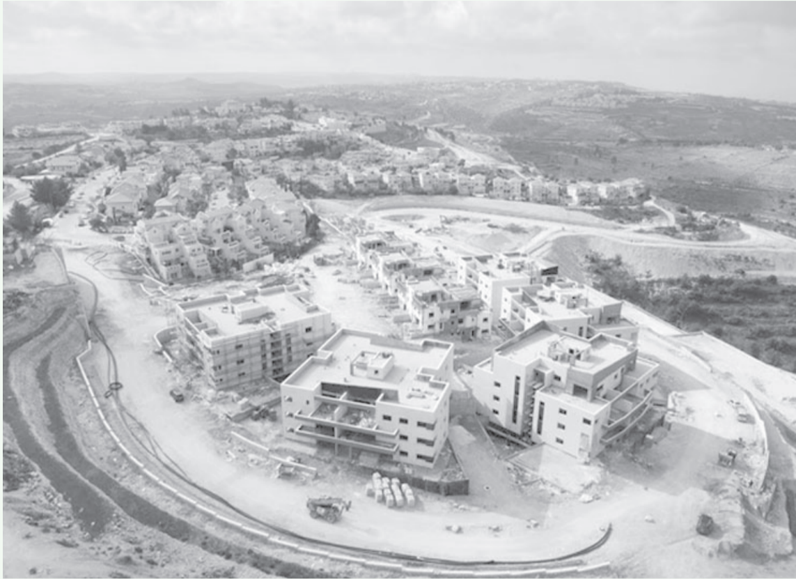
مخطط استيطاني لاقتحام مناطق (أ) والسيطرة على ١٠٠ موقع استراتيجي بالضفة

تتطلب إجراءات تشريعية معقدة أو طويلة، بل تكفي بقرار سياسي واحد يقرب الموازين الأمنية في المنطقة لسنوات مقبلة.