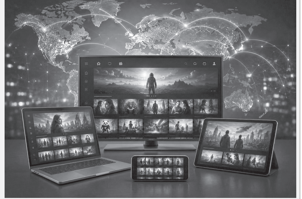
أن منصة نتفليكس حافظت على صدارة خدمات البث الترفيهي عالمياً خلال عام ٢٠٢٥، بعد أن وصل عدد أظهرت بيانات نشرها موقع Digital Trends

ووفقاً للبيانات جاءت منصة أمازون برايم فيديو في المرتبة الثالثة بنحو ٢٠٠ مليون مشترك، تلتها HBO Max بحوالي ١٢٨ مليون مشترك ثم Disney+ بنحو ١٢٧,٨ مليون مشترك، كما ضمت القائمة منصات آسيوية بارزة مثل iQIYI وTencent Video ما يعكس تنامي حضور الشركات الآسيوية في سوق البث الرقمي العالمي، وتشير الأرقام إلى استمرار النمو في الطلب على خدمات المشاهدة عبر الإنترنت، مدفوعاً بتوسع استخدام الهواتف الذكية وانتشار الإنترنت عالي السرعة إلى جانب استثمارات متزايدة من الشركات في إنتاج المحتوى الحصري والأعمال الأصلية لجذب المشتركين والحفاظ عليهم كما تبرز النتائج التحول المتسارع في خريطة المنافسة العالمية إذ لم تعد الهيمنة مقتصرة على الشركات الأمريكية في ظل صعود منصات آسيوية استطاعت توسيع قواعدها الجماهيرية مستفيدة من الأسواق المحلية الضخمة وحقوق بث الأحداث الرياضية والمحتوى الترفيهي المتنوع، وتعكس هذه المؤشرات استمرار ازدهار قطاع البث الرقمي عالمياً، مع توقعات بمواصلة المنافسة بين المنصات الكبرى خلال السنوات المقبلة في سبيل زيادة أعداد المشتركين وتعزيز حصتها في سوق يشهد نمواً متسارعاً.