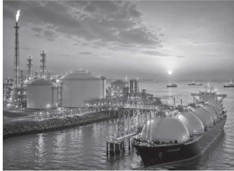
وأثرت الاضطرابات في حركة الشحن عبر مضيق هرمز على توقعات الأسواق، باعتبار الممر البحري أحد المسارات العالمية، خصوصاً أن الدوحة تعد من أبرز اللاعبين في سوق الغاز المسال وتساهم بحصة كبيرة من التجارة الدولية.

الحوية لنقل الطاقة من منطقة الخليج إلى مختلف أنحاء العالم إلا أن عودة حركة الناقلات تدريجياً عززت التوقعات بتحسّن الإمدادات، وبحسب مؤشرات قطاع الطاقة فإن المنشآت التي لم تتعرض لأضرار مباشرة قادرة على العودة إلى مستويات التشغيل المعتادة خلال فترة قصيرة في وقت تواصل فيه الجهات المختصة تقييم الأوضاع التشغيلية والأمنية.