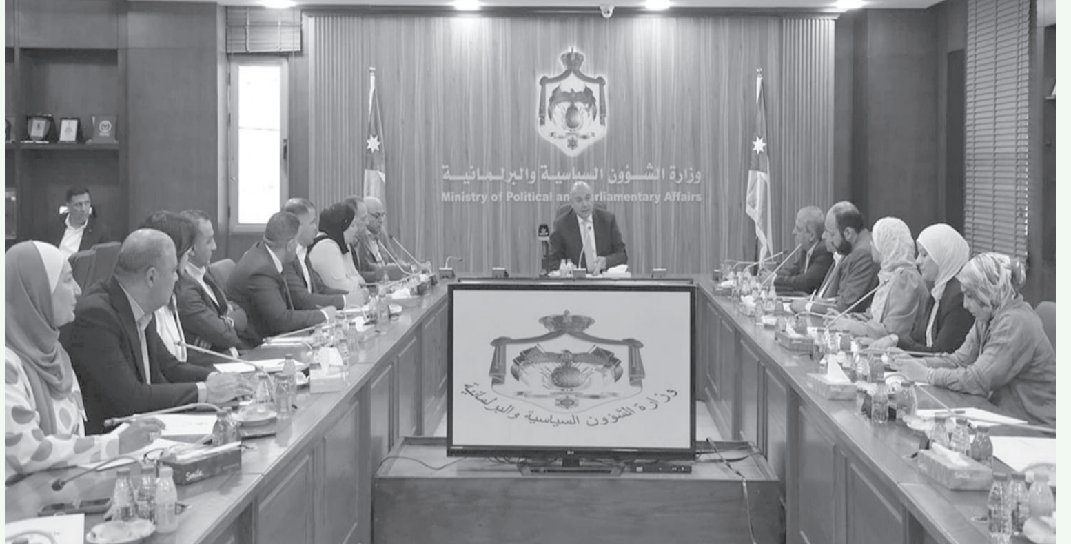
الإنباط - عمان

واقعية، وإلى قراءة موضوعية للواقع واستشراف مستقبلي للتحديات والفرص، وهو ما يجعل من الجامعات ومراكزها البحثية شريكاً أساسياً في دعم جهود الدولة ومؤسساتها المختلفة.. وقال إن الأردن دخل مرحلة جديدة من العمل الوطني تستند إلى رؤية إصلاحية شاملة، تجسدت في مسارات التحديث، باعتبارها مشاريع وطنية مترابطة تهدف إلى تعزيز قدرة الدولة على مواجهة التحديات والاستجابة لتطلعات المواطنين، خاصة الشباب بوصفهم الطاقة المتجددة للمجتمع والركيزة الأساسية لمستقبل الوطن. ولفت العودات إلى أن الجامعات تسهم في تشكيل وعي الشباب وتعزيز قيم المواطنة الفاعلة والانتماء والمسؤولية الوطنية، بما يسهم في إعداد جيل قادر على المشاركة في الحياة العامة، والإيمان بأهمية العمل الحزبي والبرلماني باعتباره جزءاً أساسياً من منظومة العمل