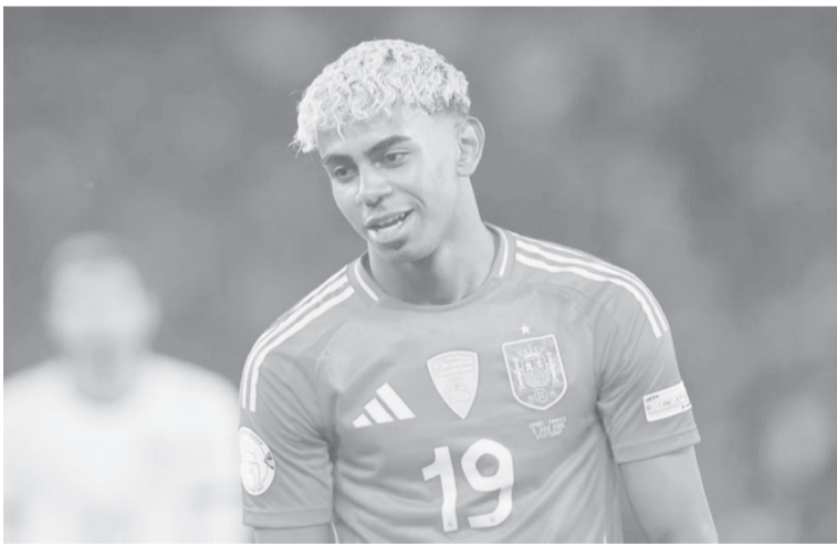
الأبواب - عمان

أويراسابال، كانت لديه بعض المشكلات البسيطة، لا يمكننا القول كل شيء، لكنه يواصل تقديم مردود استثنائي، في إشارة إلى صاحب النتالية والتعبيرية الحاسمة. وأوضح أن مهاجم ريال سوسيداد "له تأثير هائل في المنتخب، لا يمتلك أي لاعب آخر في العالم. في هذه المباراة، كان أول لاعب يسجل هدفين ويصنع هدفاً في ٢٤ دقيقة، وتابع المدرب البالغ ٦٥ عاماً "يجب أن نواصل التطور إذا أردنا بلوغ يوم ١٩ تموز يوم المباراة النهائية)، واليوم هناك أيضاً تقد ذاتي، الجانب الأكثر إيجابية هو أن هذا المنتخب يمتلك هامشاً استثنائياً للتطور. اليوم صرحنا بعض جوانب اللعب التي لم تعمل بشكل جيد في المباراة الماضية، من جانبه، قال لاعب وسط برشلونة داني أولو إن هذه المباراة "تمنحنا شعوراً أفضل من المباراة الأولى، هنا واضح، لكننا كنا نعلم أنه باللعب بالطريقة التي نلعب بها دائماً، ستأتي النتائج والأهداف. وختم في المنطقة المختلطة "الثقة لدينا منذ البداية، نملك المستوى والجودة، وعلينا فقط أن نظهر ذلك على أرض الملعب، وهذا كل شيء".