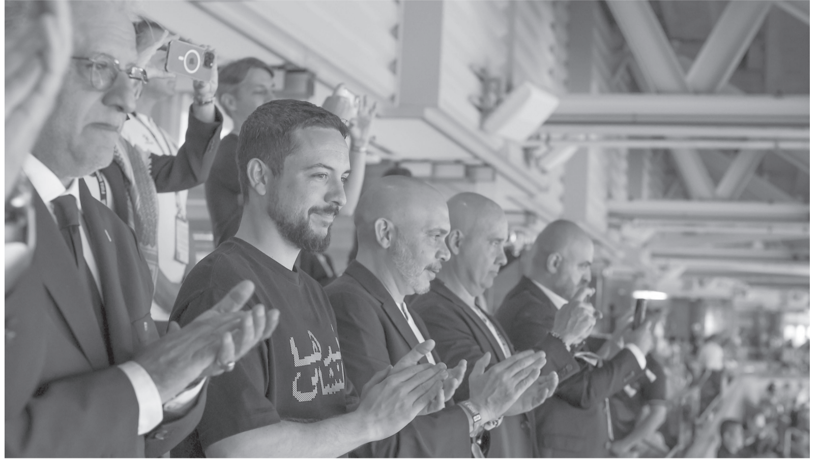
الأنباط - مينا بن ياسين

قال سمو الأمير الحسين بن عبدالله الثاني، ولي العهد، إن أداء المنتخب الوطني في مباراته بكأس العالم لم يعكس أنه يخوض مشاركته الأولى في البطولة، مشيداً بأداء الذي قدمه اللاعبين.