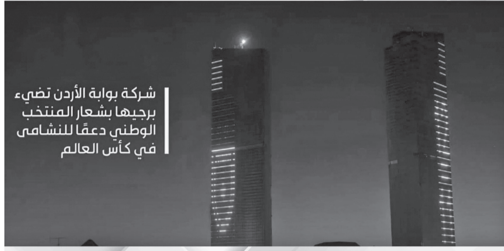
مشواره في نهائيات كأس العالم، من خلال إضاءة البرجين بشعار النشامى، متمنية لهم التوفيق وتحقيق نتائج مشرفة الساحة العالمية.