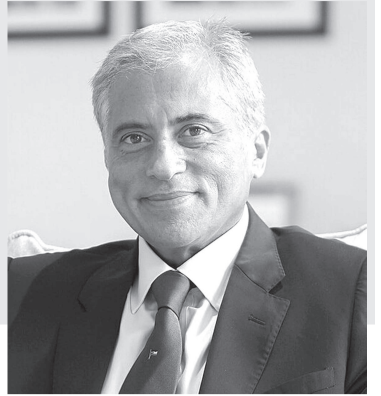
الانباط - عمر كلاب

في إقليم يضح بالحروب والصراعات والاضطرابات الاقتصادية، تبدو مهمة أي حكومة بالغة الصعوبة، خصوصاً عندما يتعلق الأمر بالموازنة بين الحفاظ على الاستقرار المالي والاستجابة للضغوط العيشية التي يواجهها المواطنون. وفي هذا السياق، يبرز أداء رئيس الوزراء الدكتور جعفر حسان بوصفه نموذجاً لإدارة تقوم على الواقعية الاقتصادية والعمل التنفيذي الهادئ بعيداً عن الضجيج السياسي أو المزايدات الإعلامية التي مما يجعل القراءة المتوازنة قابلة للتحقق، رغم كلفها السياسية من مفتعل اشغال الحراق السياسية.