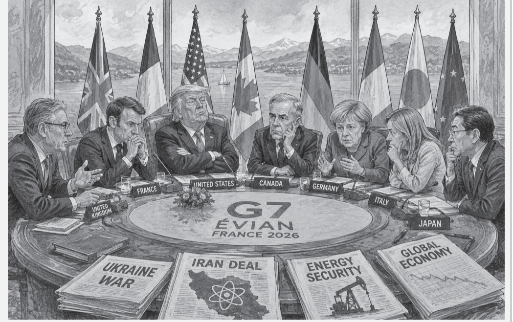
الأنباط - عمر الخطيب

وفي ظل هذا المشهد المعقد، تبدو قمة إيفيان أقرب إلى اختبار جديد لقدرة مجموعة السبع على الحفاظ على تماسكها الداخلي أكثر من كونها منصة لصناعة توافقات دولية كبرى في وقت يشهد فيه النظام العالمي تحولات متسارعة تعيد رسم موازين القوة الاقتصادية والسياسية. ومن الجدير ذكره أن قمة مجموعة السبع لعام ٢٠٢٥ عُقدت في مدينة كاناواسكيس الكندية، وركزت على ملفات عدة أبرزها دعم أوكرانيا وتعزيز التعاون الاقتصادي وأمن سلاسل الإمداد بالإضافة إلى قضايا الذكاء الاصطناعي والطاقة والتحديات الاقتصادية العالمية.