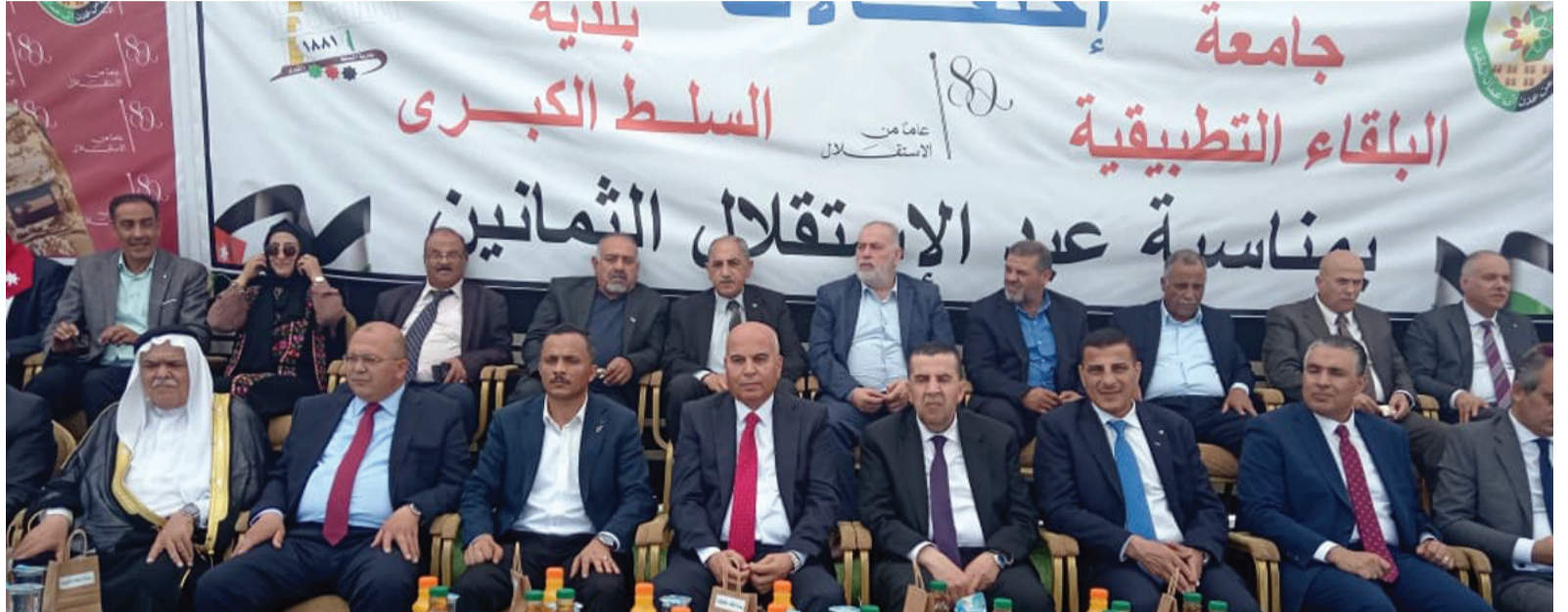
السلط - الانباط

في مشهد وطني مهيب جسد أسمى معاني الولاء والانتساب وتموجاً للانضمام بين المؤسسات الرسمية والمدنية وهيئات المجتمع المحلي نظمت بلدية السلط الكبرى بالتعاون مع عمادة شؤون الطلبة في جامعة البلقاء التطبيقية احتفالاً وطنياً مميزاً بمناسبة عيد الاستقلال الثمانين للمملكة الأردنية الهاشمية وعكس الإحتفال الذي شهد حضوراً لافتاً وتنظيماً مميز روح الفخر والإعتزاز بالوطن وقيادته الهاشمية الحكيمة مشكلاً لوحة وطنية فسيخائية تجمع كافة أطراف المجتمع في مدينة السلط. وتخلل الحفل فقرات وطنية وثقافية متنوعة جسدت مسيرة الإنجاز والعطاء التي يشهدها الأردن وسط أجواء من الفرح والمحبة والفخر بهذه المناسبة العزيزة على قلوب الأردنيين واشتملت فعاليات الإحتفال على عرض