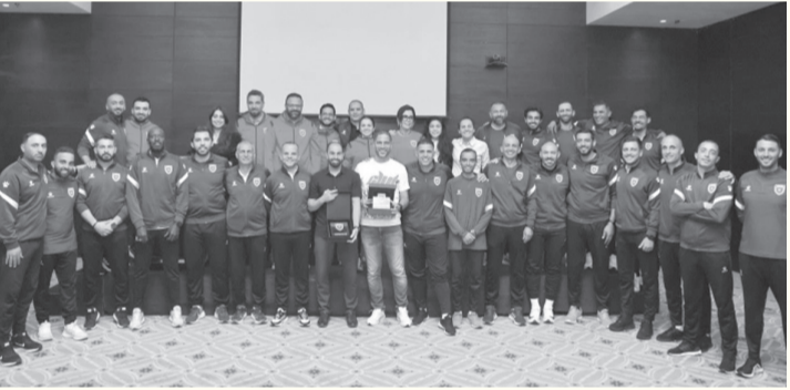
الأبناط - عمان

وبرامج التدريبات والتجمعات المقبلة، إضافة إلى متابعة تقارير المباريات السابقة والجوانب الإدارية، بما يسهم في تعزيز جاهزية المنتخبات الوطنية للاستحقاقات المقبلة. وتأتي هذه الورشة ضمن سلسلة البرامج التي ينفذها الاتحاد، في إطار حرصه على تطوير ودعم قطاع المنتخبات، والارتقاء بالعمل الفني، وتوحيد الجهود نحو تحقيق إنجازات مميزة على المستويين الإقليمي والقاري.