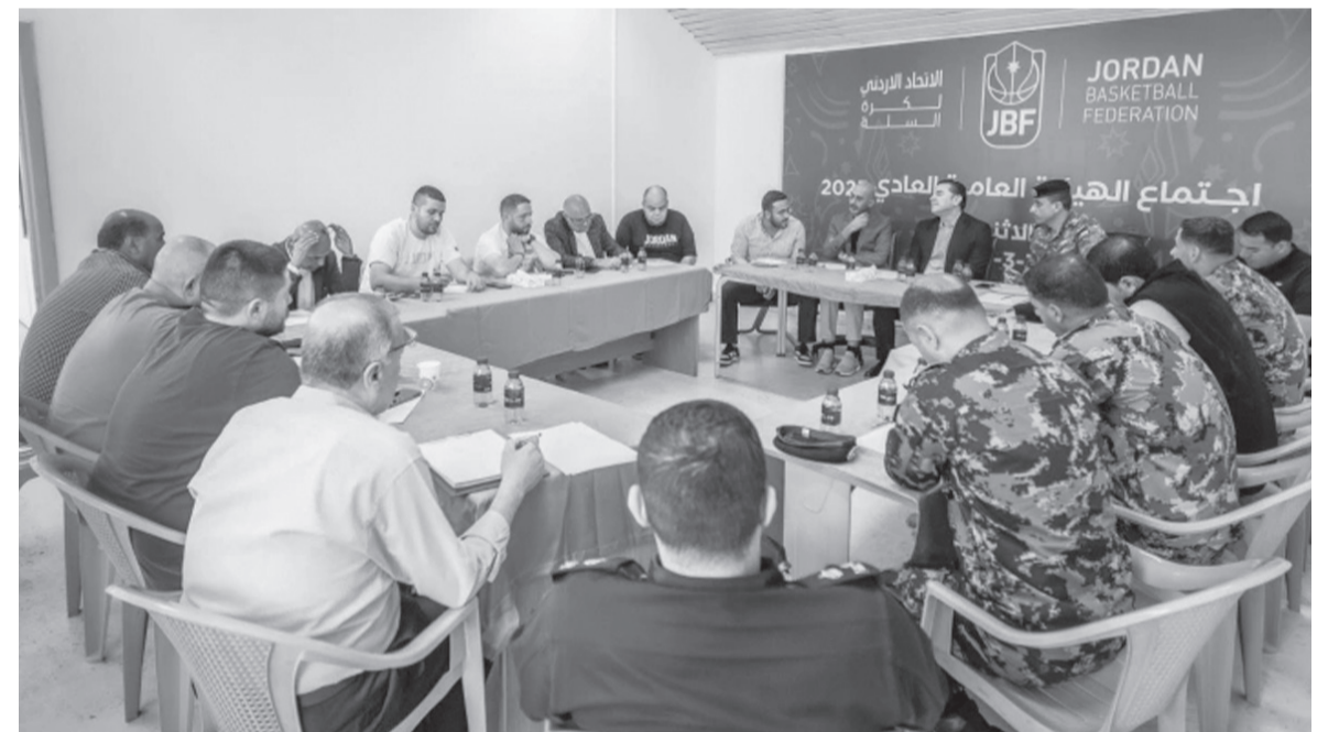
الأبناط - عمان

الفريقين لضمان انسيابية الحركة والتنظيم. وأكد الاتحاد اقتصار الدخول إلى المنصة الرسمية على أعضاء مجلسي إدارة الناديين والرعاة الرسميين وضيوف الاتحاد، فيما تم تخصيص البوابتين الخارجيتين رقم (هـ و) لدخول حافلات الفريقين الرسمية والضيوف المعتمدين فقط. كما شددت التعليمات على منع دخول أي شخص لا يحمل تذكرة رسمية إلى محيط الصالة الرياضية، وعدم السماح بإدخال القذاحات والدخان بكافة أشكاله والأطعمة والمشروبات واللعاب الصلبة وزجاجات المياه، حفاظاً على سلامة الجماهير وسير المباراة بالشكل التنظيمي المطلوب.