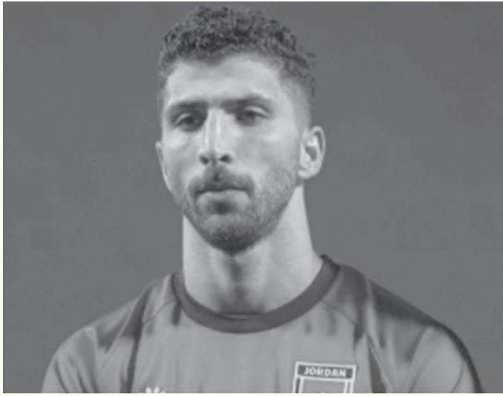
الأبناط - عمان

الفردية مع منتخب النشأمة. وبحسب الاتحاد أعرب سموه خلال الاتصال عن تمنياته بالشفاء العاجل للاعب السميري، مؤكداً تقديره لدوره وأدائه مع المنتخب الوطني خلال المنافسات السابقة، وتمنياً لمنتخب النشأمة التوفيق في منافسات كأس العالم ٢٠٢٦.