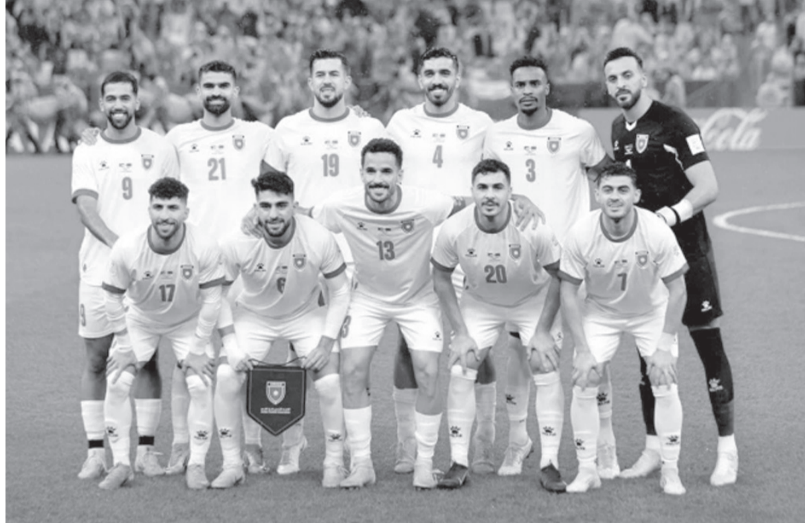
الأبناط - عمان

يبدأ المنتخب الوطني لكرة القدم الخميس، مرحلة التحضير الأخيرة، قبل المشاركة التاريخية في منافسات كأس العالم ٢٠٢٦ التي تقام في الولايات المتحدة الأمريكية والمكسيك وكندا اعتباراً من ١١ حزيران المقبل. وعلن اتحاد الكرة أن المنتخب يبدأ غداً تجمعه الأخير استعداداً لكأس العالم، حيث يستمر التجمع في عمان حتى يوم ٢٨ الحادي موعد السفر إلى سويسرا لقاء منتخبها ودياً يوم ٣١ الحالي قبل أن يغادر إلى معسكره في مدينة سان دييغو، الولايات المتحدة خلال الفترة ١-١٠ حزيران المقبل، وسيواجه كولومبيا مساء الأحد ٧ حزيران في ملعب سنابدراجون، قبل أن يستقر في معسكره الرسمي خلال المونديال في مدينة بورتلاند الأمريكية.