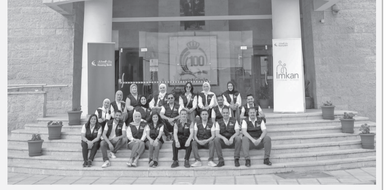
الانباط-عمان عيد، لتوزيع ملابس العيد على ١٠٠ طفل، وذلك بالتعاون مع بنك الملايس الخيري /الهيئة الخيرية الأردنية الهاشمية أقام بنك الإسكان فعالية «فرحة

بالترام مع اقتراب عيد الأضحى المبارك، وقد جاءت الفعالية كجزء من نشاطات البنك الاجتماعية المتعددة وبما يتسجم مع أهداف برنامجه المتخصص بالمسؤولية الاجتماعية «إمكان الإسكان»، والذي يحرص من خلاله على الاهتمام بفضة الأطفال ضمن قطاع التمكين الاجتماعي الذي يتبناه البنك. وشارك في الفعالية مجموعة من متطوعي بنك الإسكان ضمن برنامج «إمكان الإسكان» حيث تضمنت الفعالية أجواء ترفيهية وتفاعلية أدخلت الفرحة والسرور إلى قلوب الأطفال المستفيدين. تجدر الإشارة أن «برنامج إمكان» يعتبر