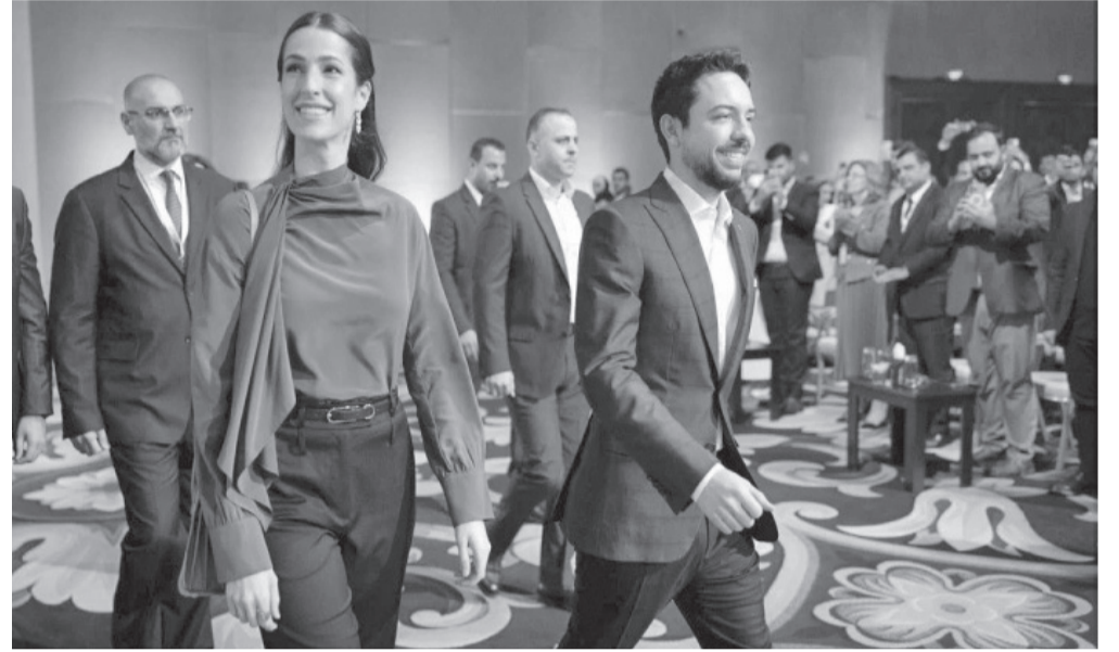
الانباط - البحر الميت

العهد وسمو الأميرة رجوة الحسين، امس السبت، في جلسة حوارية ضمن فعاليات منتدى «تواصل ٢٠٢٦»، حول أشر استخدام تقنيات الذكاء الاصطناعي في