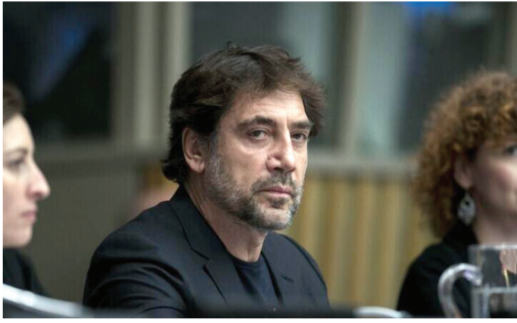
وأردف "ندرك أن النكبة لم تنته قط، فهي مستمرة اليوم في غزة على هيئة إبادة جماعية، ونظام فصل عنصري".

وأشد باردريم بإصرار الشعب الفلسطيني القوي وإرادته الراسخة في مواصلة الوجود شعباً، والبقاء في أرضه، والحفاظ على ثقافته الغنية، رغم أكثر من قرن من المهانة والتجاهل. ويتناول فيلم "اللي باقي منك" قصة أسرة فلسطينية على مدى 3 أجيال بعد نكبة 1948، ويركز على ما عاشته من صدمات وسعيها للأمل. وتم ترشيح الفيلم من قبل الأردن ضمن فئة أفضل فيلم دولي في جوائز الأوسكار. وفي مارس/آذار الماضي، صعد باردريم المسرح خلال حفل توزيع جوائز الأوسكار بمدينة لوس أنجلوس الأمريكية لتقديم جائزة أفضل فيلم بلغة أجنبية، وهدف: "لا للحرب، وفلسطين حرة"، وقد قوبلت كلماته بتصفيق حار من الحضور.