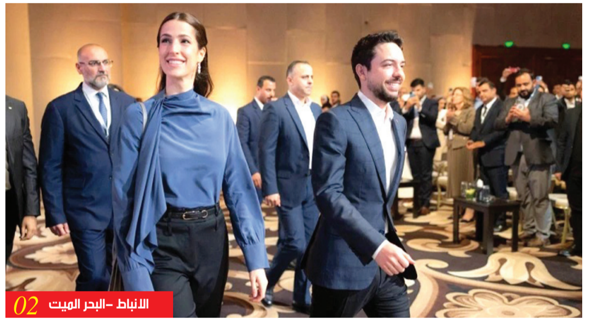
02 الانباط - البحر الميت