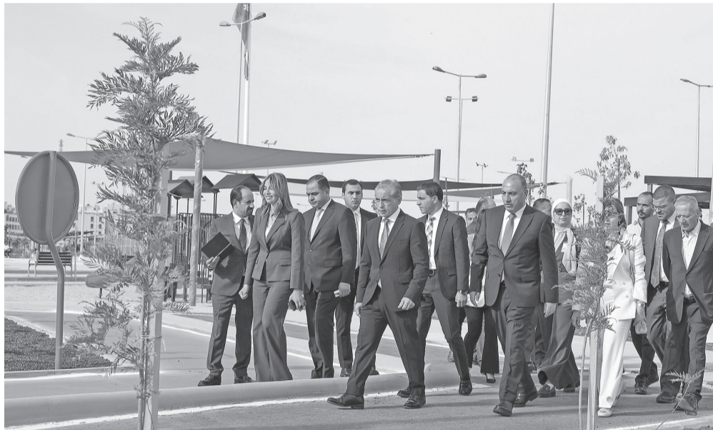
استملاكه والمكون من ثمانية طوابق؛ لنقل وزارتي السياحة والآثار والبيئة، وهيئة تشييط السياحة إليه.

تخصيص المهني الهجور للحديقة لنقل وزارتي السياحة والآثار والبيئة، وهيئة تشييط السياحة إليه.