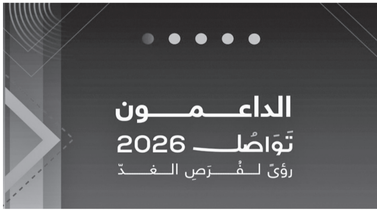
القضايا الوطنية التي يجري رصدها على مدار العام لكل نسخة، وإدماجهم في صياغة