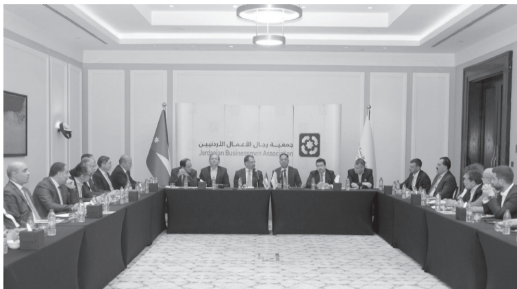
الانباط - بتر