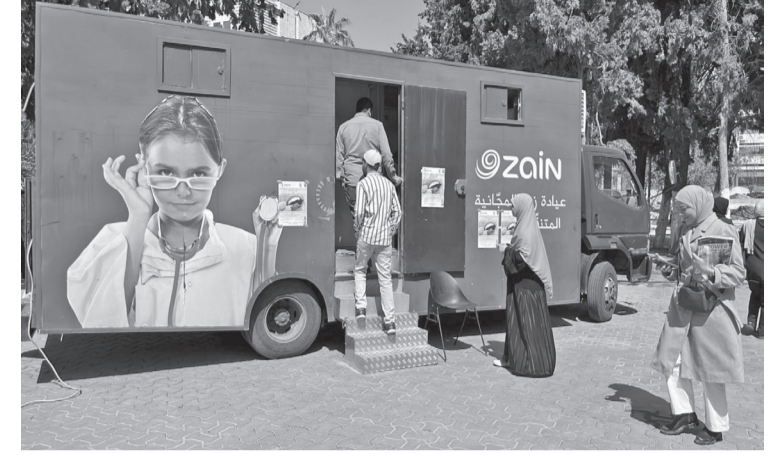
الانباط-عمان واصلت شركة زين الأردن عبر عيادتها المتنقلة المجانية تنفيذ حملاتها التوعوية والصحية بالتعاون مع الجامعة الأردنية - كلية