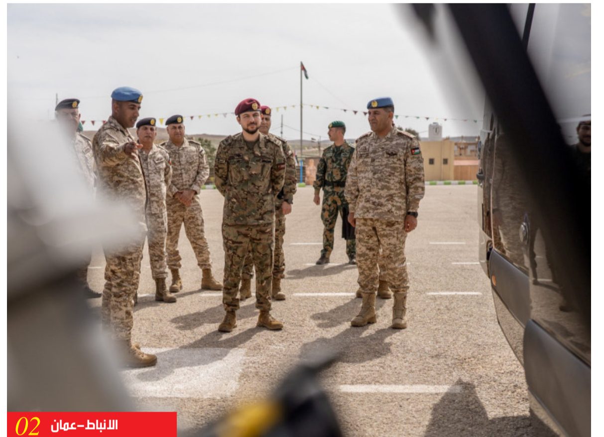
الانباط - عمان 02

ولي العهد موقعنا الملهتب كان دافعا لصقل الشخصية الوطنية