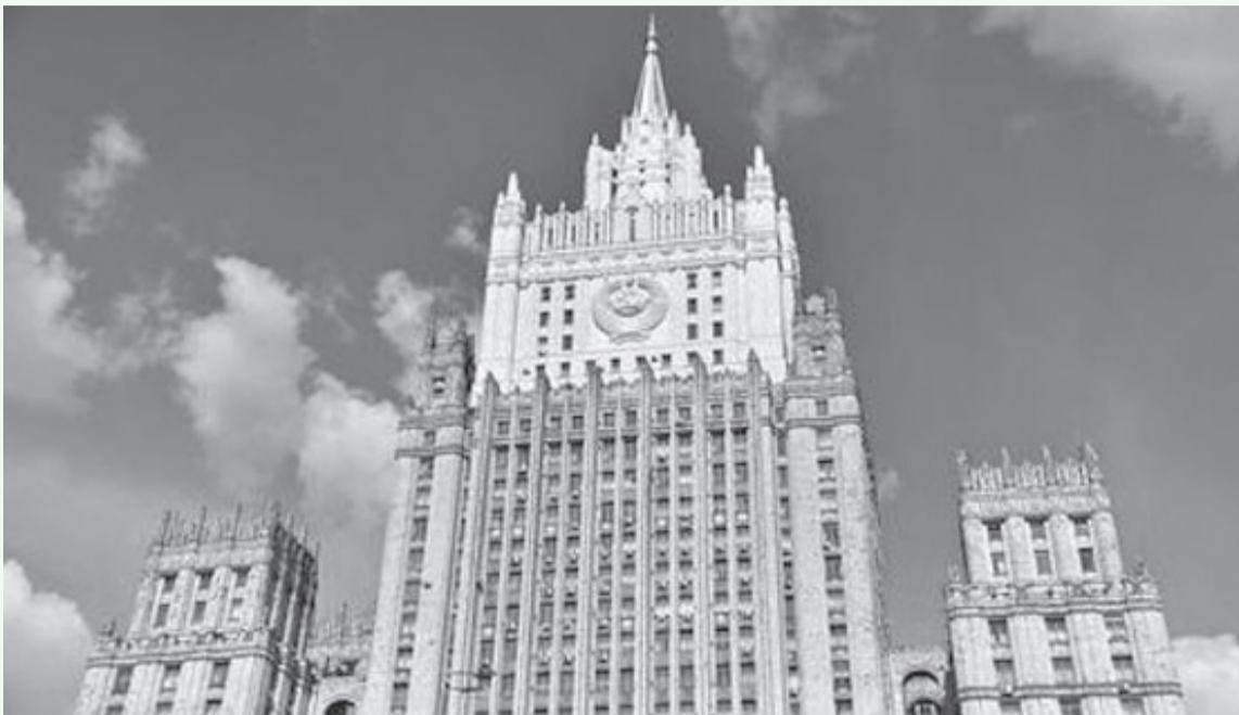
موازية يمكن فرض نتائجها على روسيا في صورة إنذار نهائي، وشهدت على أن هذا النهج "غير الدبلوماسي منفصل تماماً عن الواقع وما

وأضافت: "لا نلمس من فرنسا مقترحات بشأن إيجاد حلول مقبولة للطرفين، بل محاولات لإطلاق مبادرات