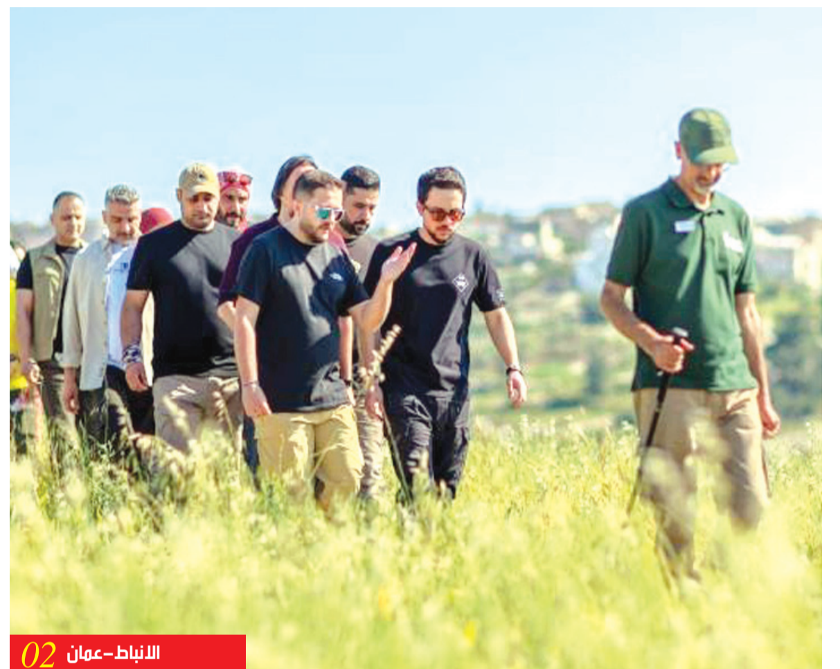
02 الانباط - عمان