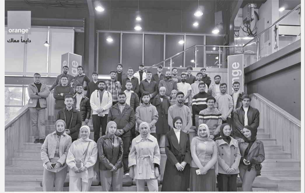
الانباط-عمان في إطار التزامها بدعم الشباب وتمكينهم بالمهارات الرقمية والمهنية، نظمت أورنج الأردن ضمن خلال مركز

لمزيد من المعلومات، يرجى زيارة موقعنا الإلكتروني: www.orange.jo