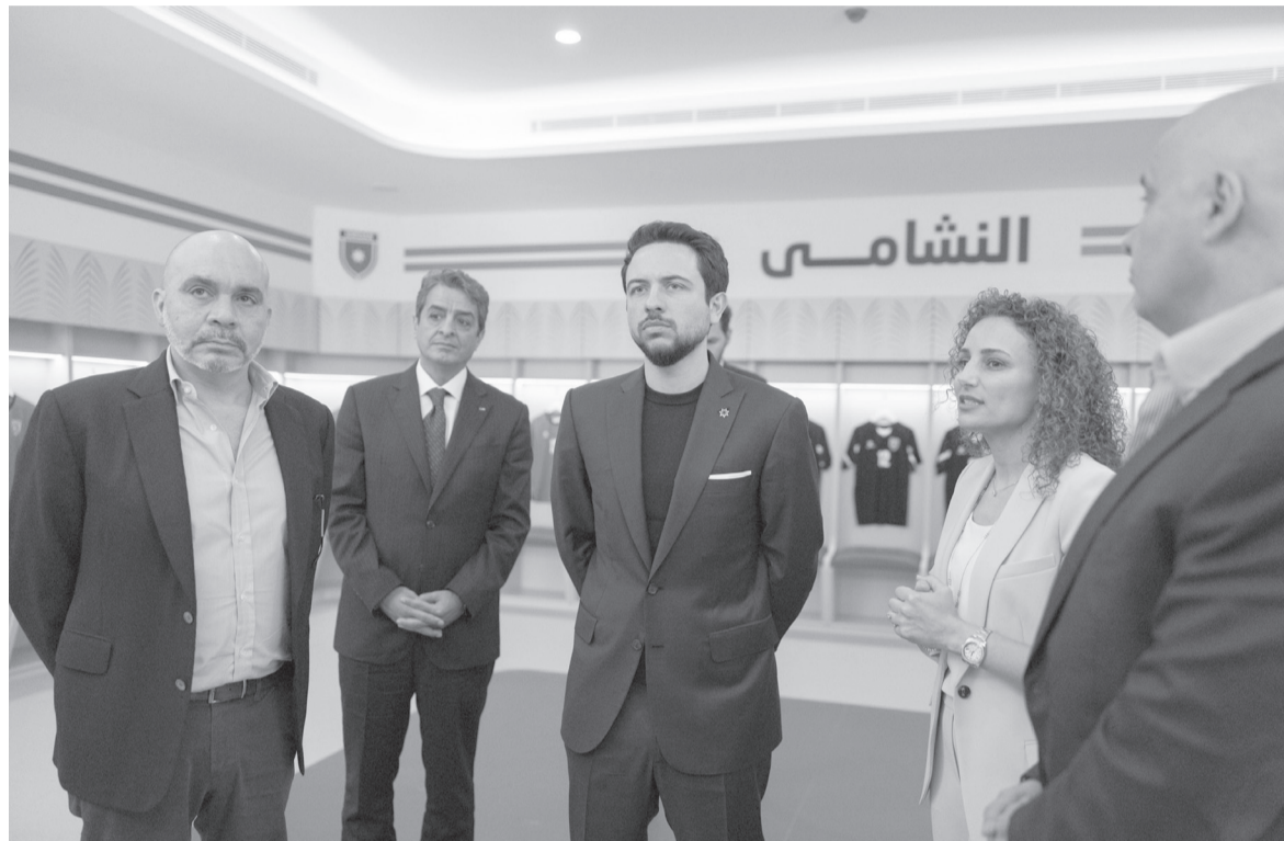
الأبطال - مينا بني ياسين

في لحظة مفصلية تعكس تحوُّلاً استراتيجياً في مسار كرة القدم الأردنية أعاد سمو الحسين بن عبد الله الثاني توجيه البوصلة نحو القاعدة الأهم؛ الفئات العمرية؛ قرار إعادة إطلاق مراكز الأمير علي للواعدين لم يأت كخطوة إدارية عابرة، بل كإشارة واضحة على أن استدامة الإنجاز تبدأ من حيث تصنع المواهب، لا حيث تحصد الألقاب فقط.