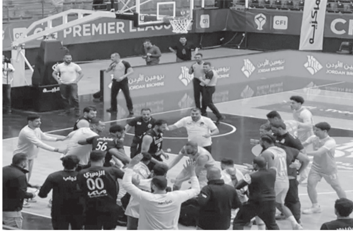
الأنباط - ميناس بني ياسين

في خطوة تعكس جدية التعامل مع الأحداث الأخيرة، أعلن الاتحاد الأردني لكرة السلة تأجيل استكمال سلسلة نهائي دوري CFI الممتاز للرجال، على خلفية الأحداث المؤسفة التي رافقت المباراة الثانية بين الفيصلي واتحاد عمان، والتي لم تستكمل بسبب ظروف ميدانية خارجة عن الروح الرياضية. وأكد الاتحاد في بيان رسمي أنه باشر فوراً عبر لجانه المختصة مراجعة شاملة لكافة التقارير الرسمية المتعلقة بالمباراة، بما يشمل تقارير الحكام والمراقبين والتسجيلات المتاحة، تمهيداً لإحالة الملف إلى لجنة الانضباط والسلوك لاتخاذ الإجراءات اللازمة وفق الأنظمة المعمدة، وبما يضمن العدالة والحياد.