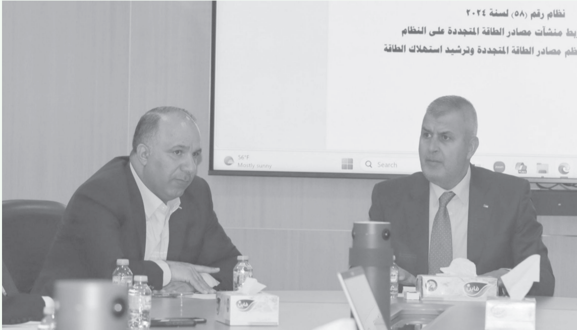
نظام رقم (٥٨) لسنة ٢٠٢٤ يخط منشآت مصادر الطاقة المتجددة على النظام نظم مصادر الطاقة المتجددة وترشيده استهلاك الطاقة

ترأس وزير الطاقة والثروة المعدنية الدكتور صالح الخرابشة، امس الثلاثاء، اجتماع مجلس الشراكة لقطاع الطاقة، لبحث التعديلات المقترحة على نظام تنظيم ربط منشآت مصادر الطاقة المتجددة على النظام الكهربائي رقم (٥٨) لسنة ٢٠٢٤، من خلال إدخال أنظمة التخزين عليها وفقاً لشروط فنية محددة.