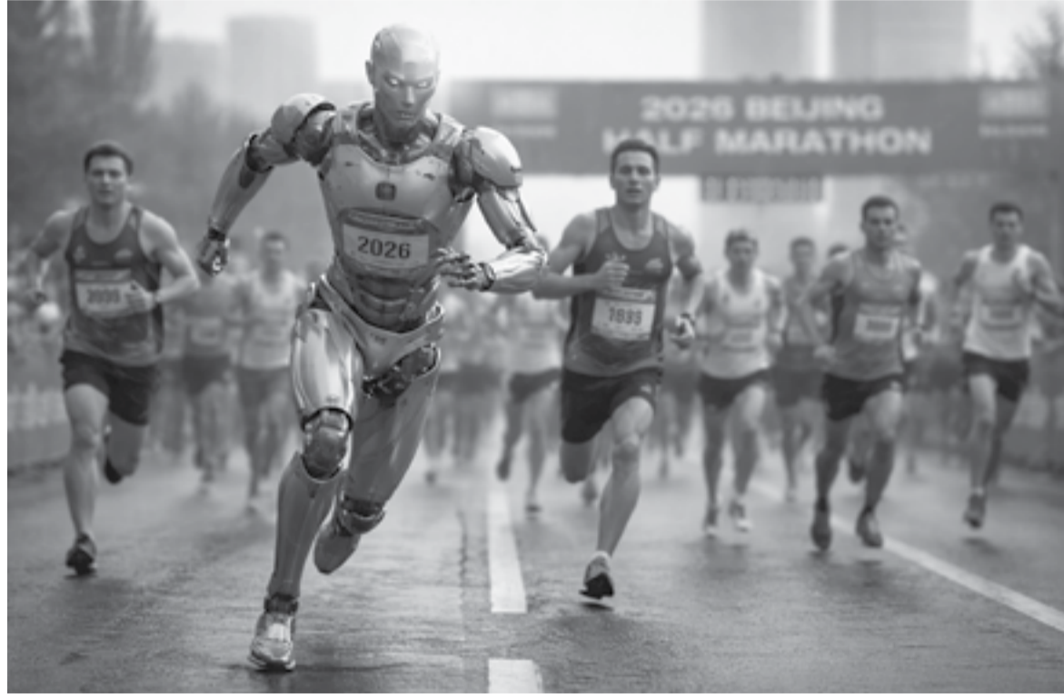
الأبواب - مينا بن ياسين

في مشهد بدا وكأنه مقتطع من فيلم خيال علمي، لم يعد المتسابق الأسرع في نصف ماراثون بكين لعام 2026 إنساناً بل روبوتاً، هذا الحدث الذي أقيم ضمن فعاليات Beijing E-Town Half Marathon لم يكن مجرد سباق رياضي تقليدي، بل لحظة فارقة أعادت طرح أسئلة جوهرية حول مستقبل الرياضة وحدود القدرات البشرية في عصر تتسارع فيه التكنولوجيا بوتيرة غير مسبوقة للمرة الأولى، تنجح آلة في التفوق على الرقم القياسي البشري في سباق نصف ماراثون حقيقي، في مشهد يجمع بين الإبهار والقلق، ويؤسس لمرحلة جديدة من التفاعل بين الإنسان والآلة داخل المجال الرياضي.