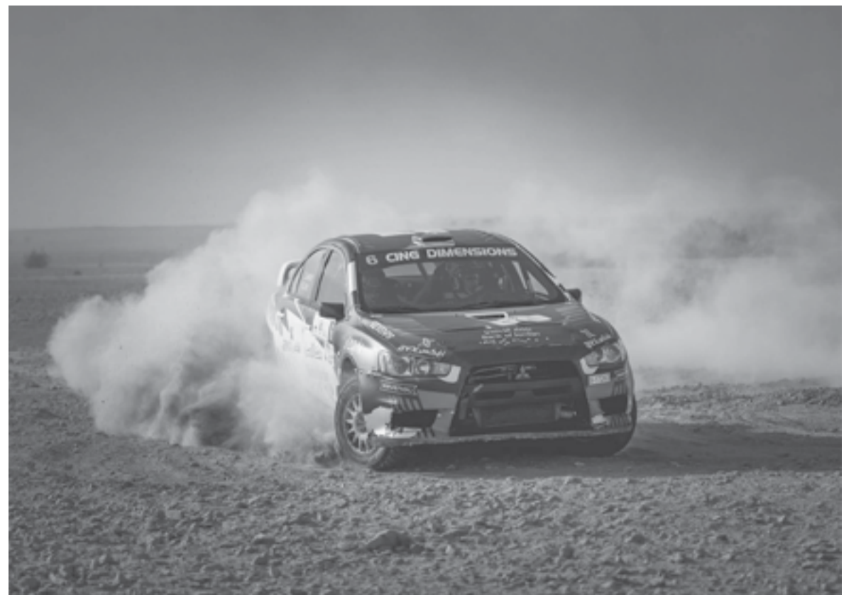
الأبواب - عمان

وضعت الأردنية لرياضة السيارات، اللمسات الأخيرة على رالي الأردن، (الجولة الثالثة من بطولة الشرق الأوسط للراليات) الذي يقام خلال الفترة من 14 - 16 أيار المقبل. ويتضمن الرالي نحو 12 مرحلة خاصة على الطرق الحصوية في