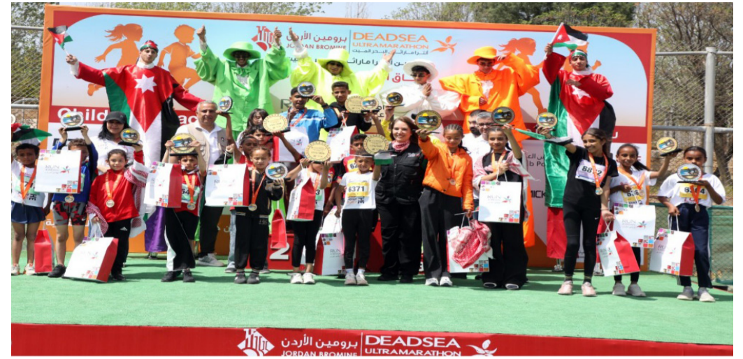
الانباط - برا

كما يواصل الحدث هذا العام بعده الإنساني، من خلال تخصيص ٢٠ بالمئة من رسوم الاشتراك لدعم أهلنا في غزة، بالتعاون مع الهيئة الخيرية الأردنية الهاشمية.