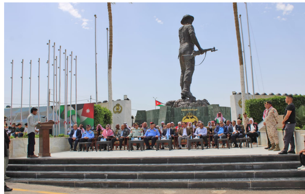
الانباط-بترا احتفلت صروح الشهداء، الخميس، بيوم العلم الأردني، في مشاهد وطنية جسدت معاني الفخر والانتماء والاعتزاز براهية الوطن التي توحد الأردنيين تحت ظل القيادة الهاشمية.

كما أقام صرح الشهيد/ الشمال احتفالاً بيوم العلم الأردني، بمشاركة هيئة شباب كلنا الأردن ومدرسة وروضة رواد العلم الأساسية، وسط حضور واسع من الطلبة. وتضمن الاحتفال فعاليات وطنية وقصائد شعرية تغنت بالوطن وقائدته، مجسدة بذلك معاني الولاء والانتماء، ورست قيم الوفاء لتضحيات الشهداء، في إطار تعزيز الهوية الوطنية لدى الأجيال الشابة وترسيخ روح المواطنة الصالحة.