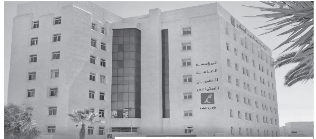
المؤسسة العامة للضمان الاجتماعي

وشددت المؤسسة على أنها غير مسؤولة عن أي تعامل يتم خارج القنوات الرسمية أو مع جهات غير معتمدة، داعية المتقاعدين إلى الإبلاغ عن أي صفحات أو حسابات مشبوهة تدعي تقديم خدمات ضمن البرنامج، وذلك حفاظاً على حقوقهم ومنعاً لوقوعهم ضحية لعمليات الاحتيال.