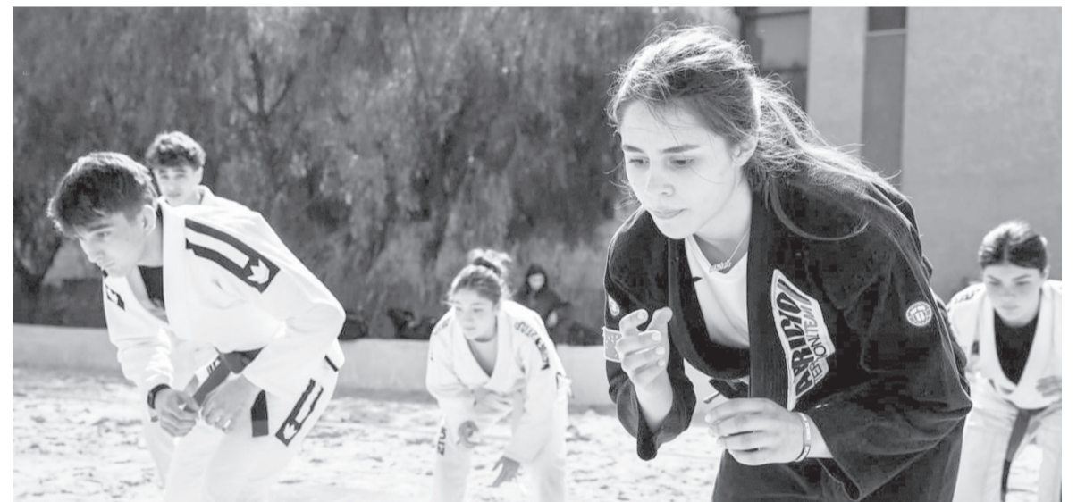
الأبطال - عمان

المكون من المدربين يزن جنب ولى القبح. وأكدت مديرية المنتخب النسوي لى القبح، أن التحضيرات تسيرو وفق البرنامج المحدد مسبقا، مشيرة إلى أن الجهاز الفني يركز خلال المرحلة الحالية على رفع الجاهزية الفنية والبدنية بما يتناسب مع متطلبات المنافسة.