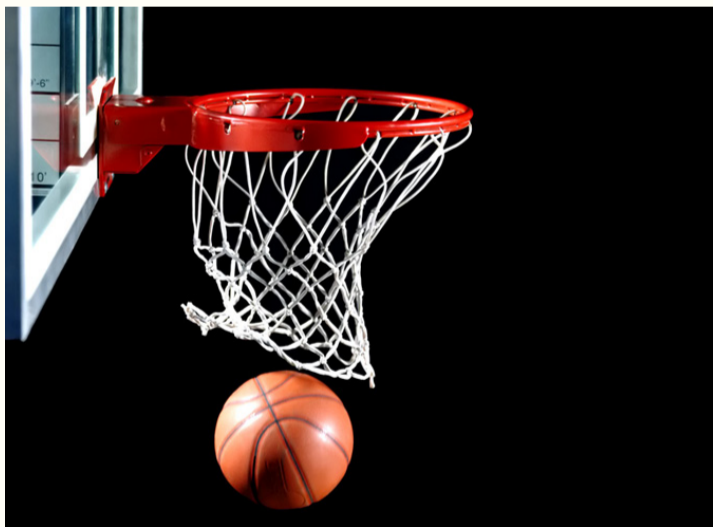
الأبطال - عمان

على أن تتأهل الفرق الحاصلة على المراكز الثلاثة الأولى من كل مجموعة إلى المرحلة الثانية، والتي تشهد دمج الفرق المتأهلة في مجموعة واحدة، تتنافس فيما بينها وفق نظام الدوري المجرى من مرحلة واحدة أيضاً، بهدف تحديد ترتيبها النهائي. ويتأهل إلى المرحلة الثالثة أصحاب المراكز الأربعة الأولى، حيث تقام مواجهات الدور نصف النهائي بنظام السلاسل القصيرة من ٣ مباريات، إذ يلتقي الأول مع الرابع، والثاني مع الثالث، ويتأهل إلى النهائي الفريق الذي يحقق انتصارين. وتختتم البطولة بإقامة الدور النهائي بنظام سلسلة من ٥ مباريات، يتوج باللقب الفريق الذي يسبق منافسه إلى تحقيق ثلاثة انتصارات، فيما يلتقي الفريقان الخاسران في نصف النهائي لتحديد المركز الثالث، ضمن سلسلة من ٣ مباريات، يحسمها الفريق الذي يحقق فوزين.