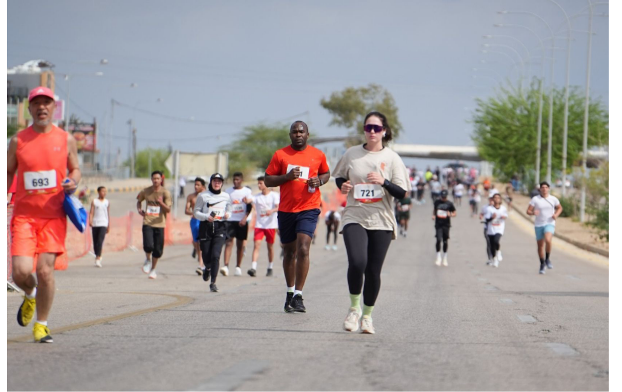
الأبطال - عمان

ويشهد السباق انطلاق المشاركين في سباق ٥٠ كم ألترا ماراتون (فردى/تتابع) و٢١ كم نصف ماراتون عند السادسة صباحاً من مقابل شاطئ