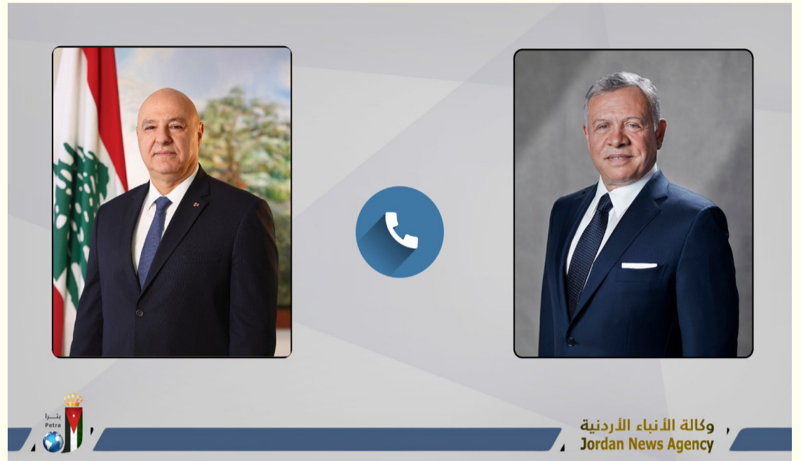
وكالة الأنباء الأردنية Jordan News Agency

بدوره، أعرب الرئيس اللبناني عن شكره وتقديره لجلالة الملك على مواقفه الداعمة للبنان وشعبه.