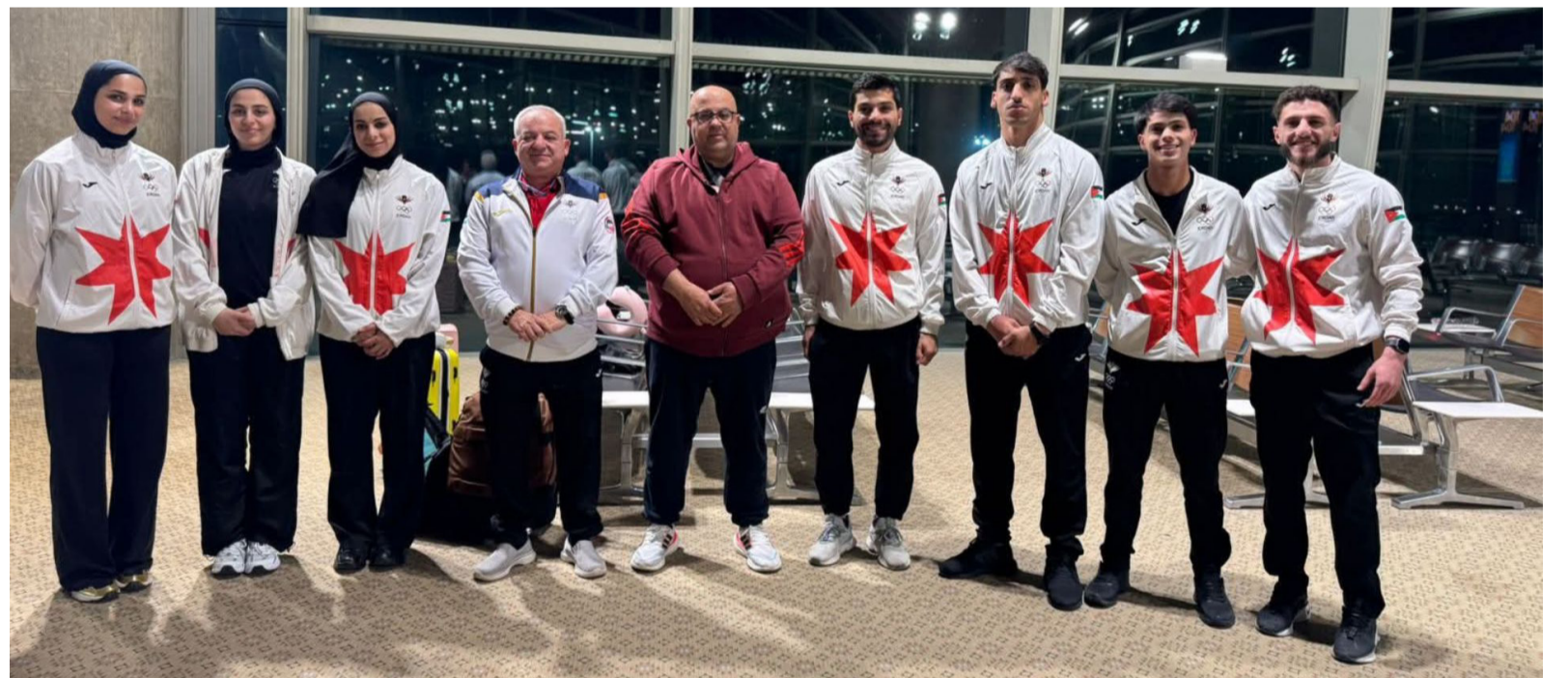
الأبطال - عمان

وتقتصر المشاركة في الدوري العالمي على أفضل ١٠٠ لاعب في التصنيف العالمي للاتحاد الدولي للكراتيه، ما يرفع من مستوى التنافس، خاصة مع حضور نخبة من أبرز الأبطال العالميين.