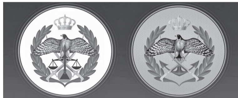
الانباط-عمان بكفاءة واقتدار.

من جانبه أعلن الناطق الاعلامي باسم مديرية الأمن العام أن الوحدات المعنية تعاملت خلال الـ ٢٤ ساعة الماضية مع ١٢ بلاغاً لحوادث مختلفة. وبين أنه لم تقع أية إصابات بحمد الله نتيجة تلك الحوادث، واقتصر الأمر على وقوع أضرار مادية بمحافظه الفرق والبادية الوسطى.