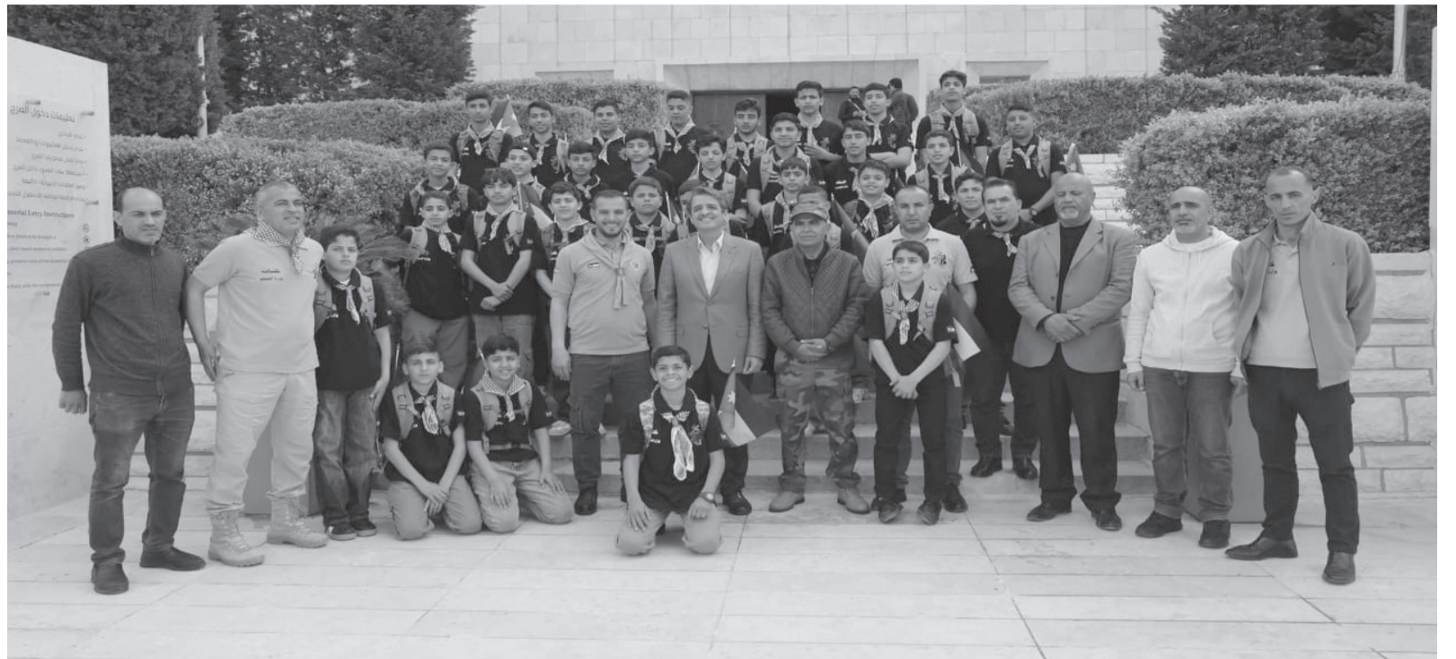
الأبطال - عمان

لدى المشاركين، وتسلط الضوء على دور الهاشميين في تأسيس الدولة الأردنية. وتتضمن فعاليات المعسكر: مسير كشفي يطبق خلاله الشباب التقاليد والمهارات الكشفية، وزيارة قصر الملك المؤسس في معان، وبيت الشريف الحسين بن علي والمتحف العسكري في العقبة.