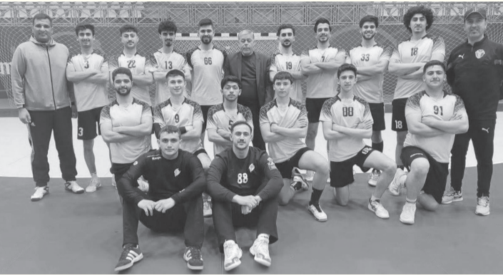
الأبطال - عمان

وفاز فريق الكتة على فريق وادي السير بنتيجة ٣١-٢١. ولحساب المجموعة الثانية والتي جرت لقاءاتها في صالة مدينة الحسن الرياضية في اربد، فاز فريق العربي على فريق ساكب بنتيجة ٣٧-٢٥، كما فاز فريق كفرنجة على فريق بركوم الشونة بنتيجة ٢٨-٢٨.