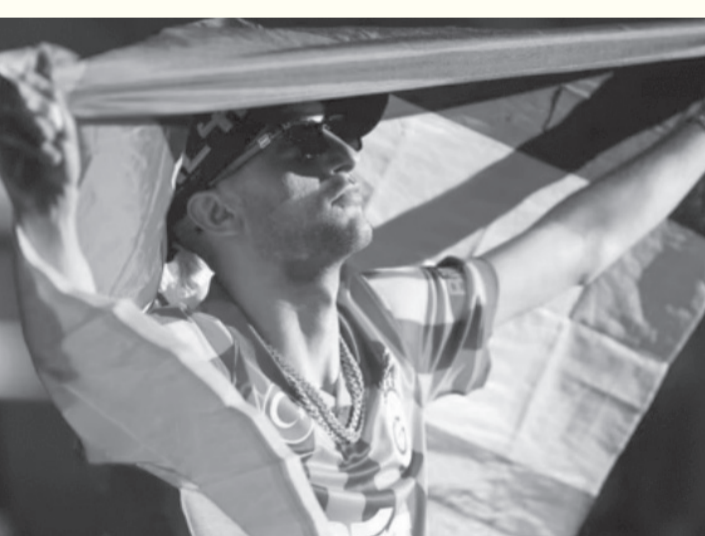
الأبطال - وكالات

إسرائيل ستوقف عن التعامل بحذر مع من وصفهم بالأعداء. وتوعد الوزير الإسرائيلي بالضيء قديماً في تطبيق عقوبة الإعدام بحق المقاومين الفلسطينيين، مشدداً على أن من سماهم «المعادين للسامية» لن يفلتوا من العقاب والملاحقة، بحسب تعبيره. وعلى الصعيد السياسي المغربي، دخل حزب العدالة والتنمية على خط الأزمة معلناً تضامنه الكامل مع حكيم زياش في وجه التهديدات الإسرائيلية التي تعرض لها. واستنكر الحزب في بيان رسمي هذه الهجمات، معتبراً أن موقف زياش يعبر عن الضمير الحي للشعب المغربي وانسجامه التاريخي مع عدالة القضية الفلسطينية ورفض جرائم الاحتلال.