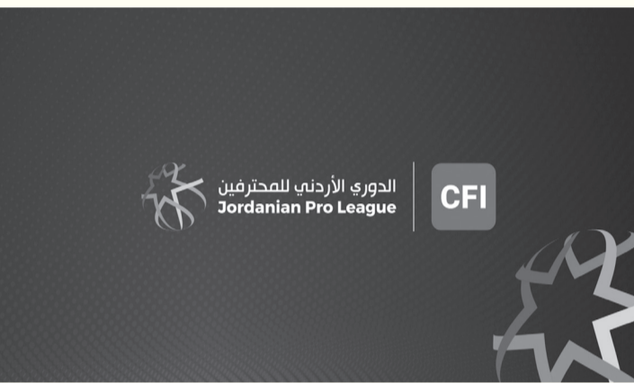
الأبطال - عمان

أمس بفوز الرمشا على شباب الأردن بنتيجة ١-٠، فيما تقام اليوم مباراتاً الأهلي والحسين اربد، والجزيرة مع الفيصلي. ويتصدر الحسين ترتيب الفرق برصيد ٤٦ نقطة، يليه الوحدات والفيصلي ٣٣ نقطة لكل منهما، ثم الرمشا ٤٢، الجزيرة ٢٩، السلط ٢٦، البقعة ٢٥، شباب الأردن ٢٢، الأهلي ١٧، والسرحان أخيراً ب٦ نقاط.