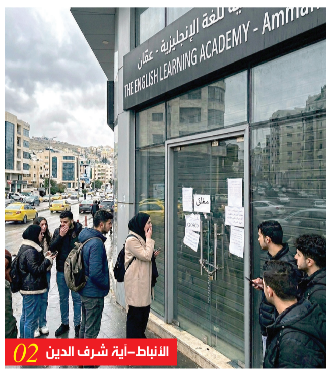
النباط-أية شرف الدين 02

الاحصاءات : أرقام غير دقيقة وتعقيد في التصنيف يحول دون حصر عدد اللاجئين على أرض المهلكة الأنباط تفتح ملف اللاجئين.. والإحصاءات تؤكد استحالة تحديد رقم دقيق