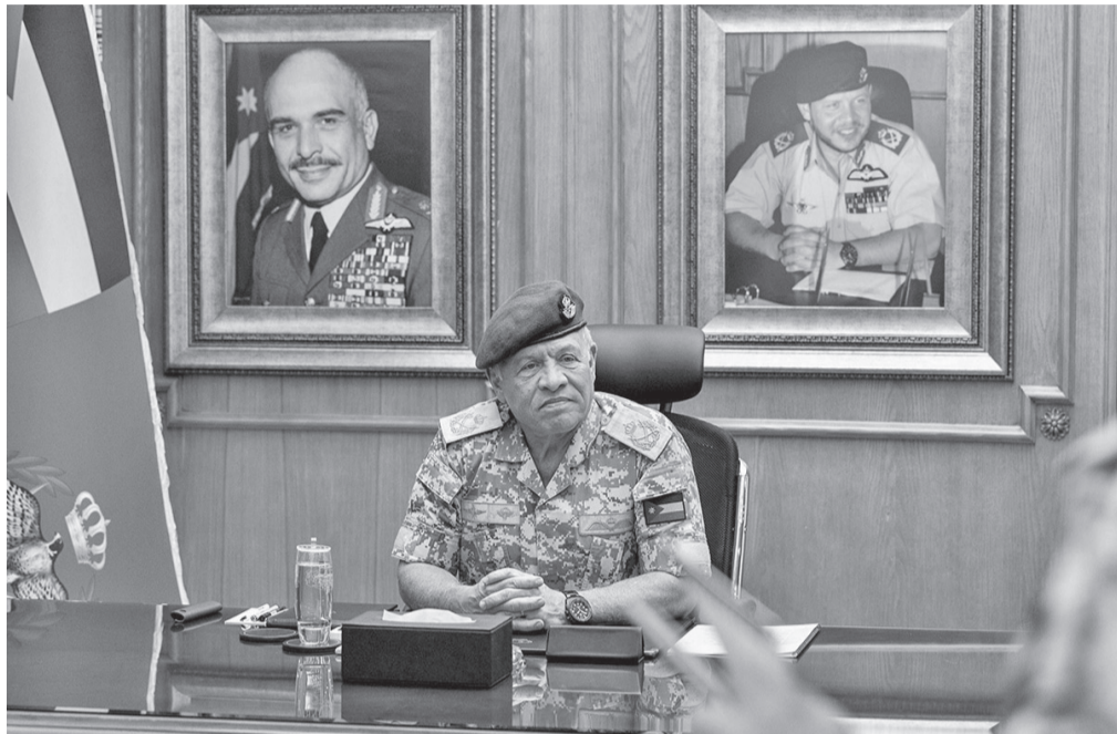
ومعنوياتهم العالية، ودورهم الحوري في حماية المواطنين وصون أمن المملكة واستقرارها.