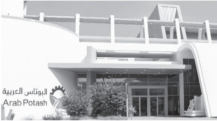
البوتاس العربية Arab Potash

زيادة الطلب على المدخلات الزراعية، وخاصة الأسمدة عالية الكفاءة.