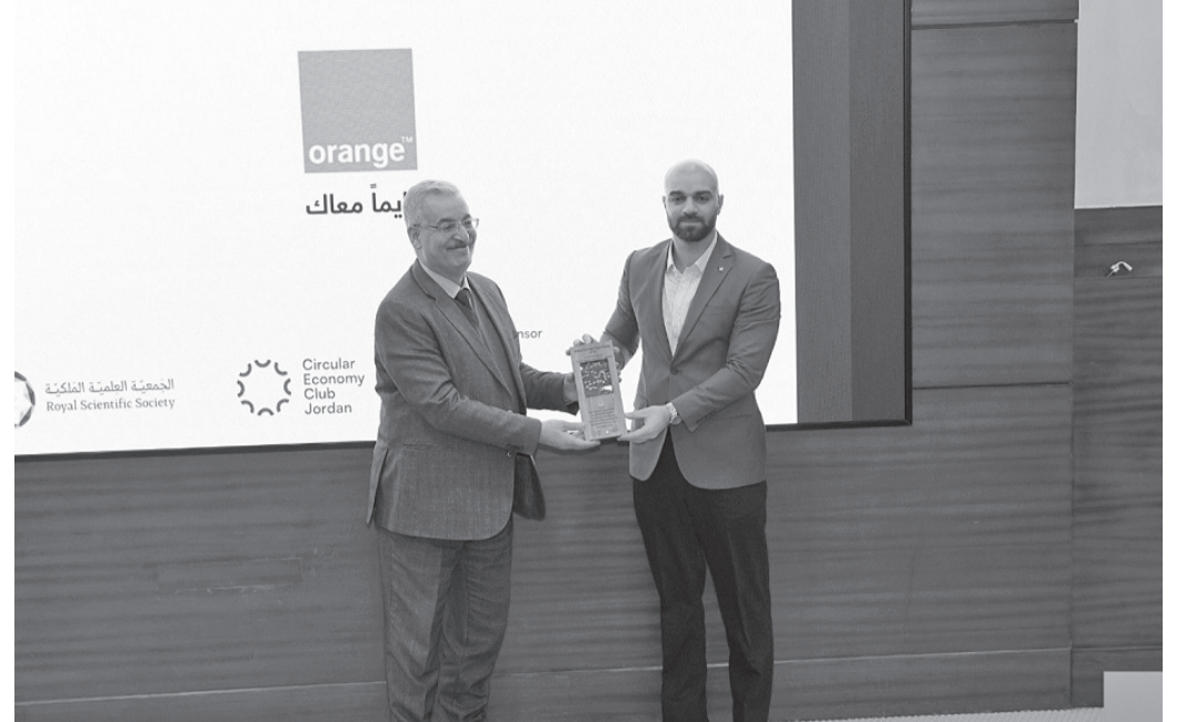
الانباط-عمان أعلنت أورنج الأردن عن دعم أسبوع الريادة العالمي لعام ٢٠٢٦ كراعي الاتصالات الحصري لحفل الختام. وتأتي هذه النسخة من الفعالية السنوية باستضافة الجمعية العلمية الملكية ونادي الاقتصاد الدائري (CEC) الأردن. ويتميز نادي الاقتصاد الدائري بكونه أول مركز وطني