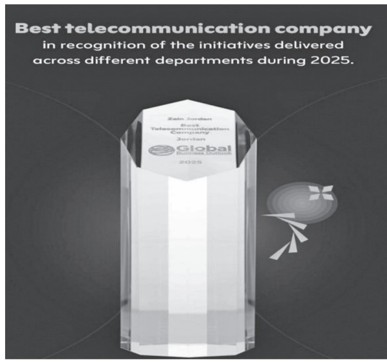
جهود فرق العمل وتكامل أدوارها عبر مختلف الأقسام، وتعكس التزام الشركة

المتواصل بتقديم أفضل الخدمات لزيائنها والمساهمة الفاعلة في دعم الاقتصاد الرقمي الوطني وتسريع وتيرة التحول الرقمي في المملكة لترسيخ مكانتها على خارطة الدول المتقدمة تكنولوجياً.