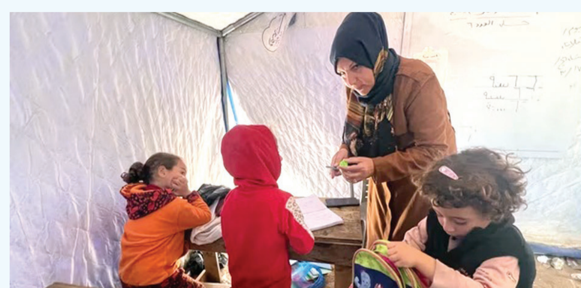
03 الانباط - وكالات

يواجه نحو مليون و500 ألف طالب وطالبة في فلسطين تحديات جسيمة تهدد مستقبلهم التعليمي، وتندثر بشعوب جبل يقتصر لأساسيات المعرفة، وتشكل هذه الشريحة الطلابية قرابة ربع سكان الضفة الغربية وقطاع غزة، مما يعكس حجم الخطر المجتمعي الناتج عن تعطل العملية التعليمية وتراجع انتظامها بشكل حاد خلال السنوات الأخيرة. في قطاع غزة، تسببت حرب الإبادة المستمرة منذ أكتوبر 2023 في انقطاع كامل للعملية التعليمية، حيث دمر الاحتلال مئات المدارس وحول التقي منها إلى مراكز إيواء. التفاصيل ص «9»