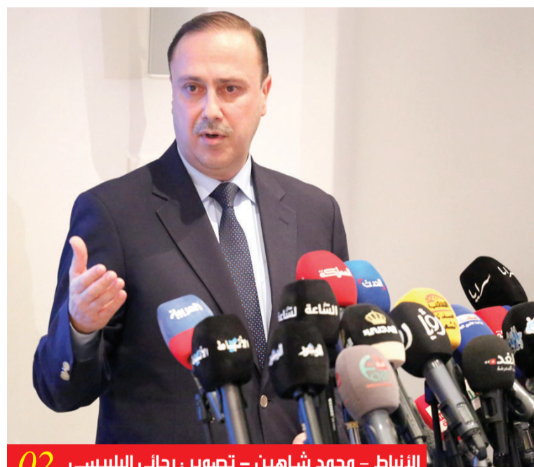
02 الانباط - ومهد شاهين - تصوير: رجاوي البليبيسي

أكد وزير الاتصال الناطق الرسمي باسم الحكومة، الدكتور محمد المومني، أن أولويات الحكومة تتمثل في الحفاظ على أمن واستقرار الأردن، مؤكداً على أن الهدف الاستراتيجي يتمثل في تخفيف تداعيات الأزمة على المواطنين. وقال المومني، خلال إيجاز صحفي عُقد أمس السبت في المركز الوطني للأمن وإدارة الأزمات، إن تقارير من مختلف القطاعات تصل بشكل دوري إلى مكتب رئيس الوزراء لدراستها، كما يتم ردها إلى جلالة الملك لتلقي التوجيهات بشكل مستمر. وأشار إلى أن من أبرز قرارات الحكومة دعم المؤسسات الاستثمارية، وعضء بعض القطاعات من الضرائب، مؤكداً أن سلاسل التوريد تعمل بانتظام واستدامة، خاصة فيما يتعلق بالسلع الأساسية والمحروقات، وأضاف أن (2024) وصلت إلى