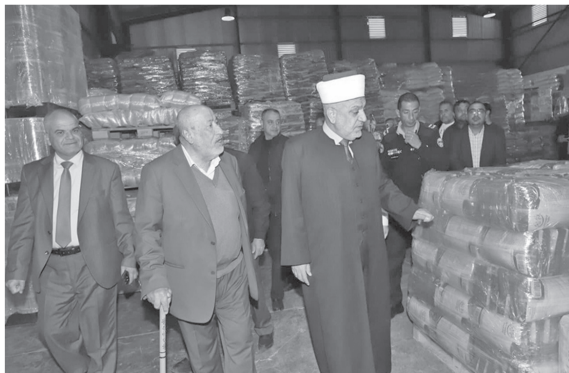
غذائي بكلفة ربع مليون دينار على مستحقيها عبر لجان الزكاة في مختلف مناطق المملكة.