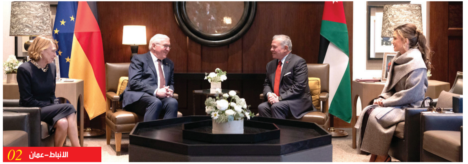
02 الانباط - عمان

ولي العهد يزور مركز تدريب خدمة العلم ويطلع على سير البرامج التدريبية ولي العهد يؤكد أهمية برنامج خدمة العلم في تنمية وصقل شخصيات المكلفين بالخدمة