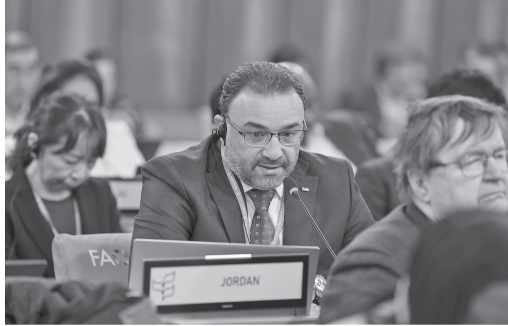
وجدد الوفد التزام الأردن بمواصلة التعاون مع الأمانة والدول الأطراف لضمان تنفيذ فعال ومتوازن لقرارات الاتفاقية، بما يسهم في دعم الجهود الدولية للحفاظ على التنوع الحيوي وتحقيق أهداف التنمية المستدامة.