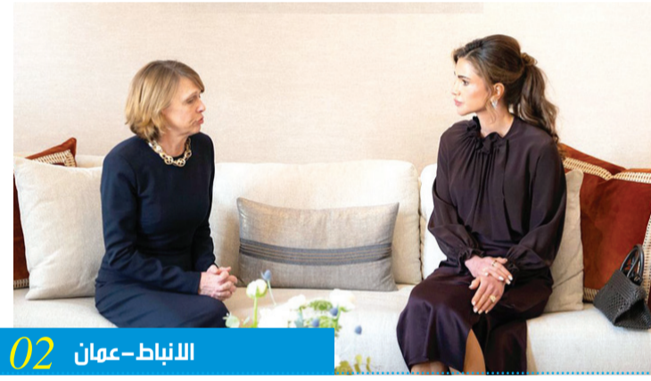
02 الانباط - عمان

الملكة رانيا العبدالله تلتقي سيدة ألمانيا الأولى في عمان