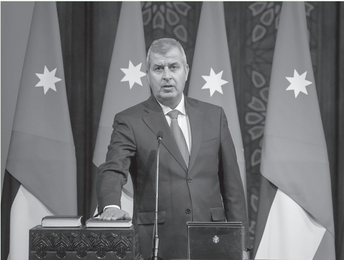
النباط - فايز الشاقلدي

أشار تصريح وزير الطاقة والثروة المعدنية صالح الخرايشة تحت قبة البرلمان خلال انعقاد الجلسة التشريعية لمناقشة مشروع ” قانون الغاز “ . عاصفةً من التساؤلات المشروعة، ليس فقط حول مخزون الأردن الاستراتيجي من الغاز، بل حول مفهوم الشفافية ذاته في إدارة أحد أكثر الملفات حساسية .. “أمن الطاقة..