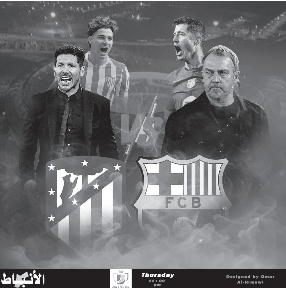
الأنباط - ميناس بيني ياسين

نهائي كأس ملك إسبانيا في مباراة تتجاوز أهميتها مجرد التأهل إلى النهائي، لتصبح اختبارًا حقيقيًا لقدرة الفريق على الصمود ذهنيًا وبدنيًا وسط هذا الزخم من التحديات، هذا التزاخم في المواعيد يضع سيميويني أمام معضلة استراتيجية شديدة الحساسية، تتمثل في كيفية توزيع الجهد بين مختلف المسابقات، وما إذا كان سيغامر ببعض الجبهات من أجل التركيز على دوري الأبطال، خشية الخروج بموسم صيفي قد تكون له تبعات كبيرة على مستقبله مع النادي.