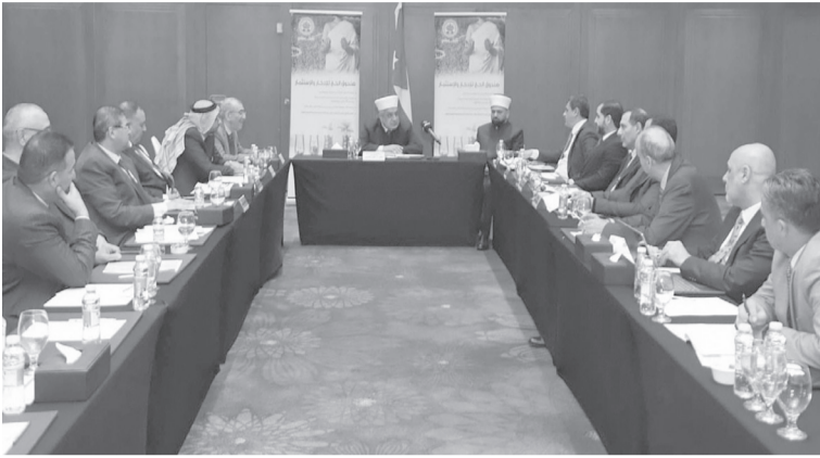
شؤون الحج والمعرة.

وأكد أن الصندوق شهد نموا ملحوظا بأعداد المخدّرين وحجم مبالغ الأرباح، حيث ارتفع عدد المخدّرين من ٧٥ ألف مدخر ومدخرة عام ٢٠٢٤ إلى ٨٥ ألفا عام ٢٠٢٥، بنسبة نمو بلغت ١٣ بالمائة، فيما ارتفع إجمالي مدخرات الصندوق من نحو ٣٧١ مليوناً و٤٨٠ ألف دينار عام ٢٠٢٤ إلى قرابة ٤٢١ مليون دينار عام ٢٠٢٥، وبنسبة نمو ١٣ بالمائة. وأشار إلى أن عدد المخدّرين الذين أدوا فريضة الحج من خلال صندوق الحج بلغ ١١ ألفاً و٥٧٣ مدخراً، مؤكداً أن هذا النمو يعكس مستوى الثقة والصداقة التي يحظى بها الصندوق، إلى جانب كفاءة إدارة استثمارات أمواله.