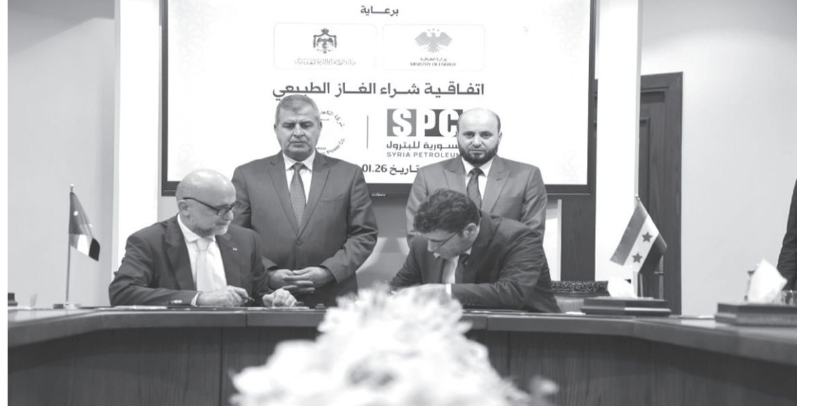
وزير الطاقة والثروة المعدنية الأردني الدكتور صالح الخرابشة ونظيره السوري المهندس محمد البشير.

منظومة الكهرباء في سوريا ودعم تشغيل محطات التوليد. وأوضح أن الأردن بدأ فعلياً بتزويد سوريا