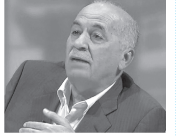
الانباط - نعمت الخورة

قال خبير الطاقة هاشم عقل إن إقدام الحكومة على إضافة اللون الأزرق إلى مادة الكاز لن يكون له أي تأثير على تركيبها أو جودتها.