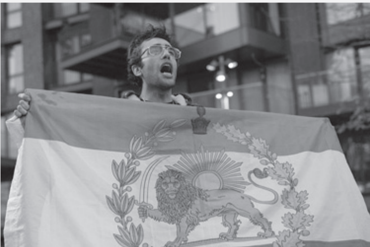
وفي ١٠ يناير/ كانون الثاني، أقدم متظاهر على نزع العلم الإيراني عن واجهة مبنى السفارة، وأبدله بعلم ما قبل الثورة الإسلاميّة.