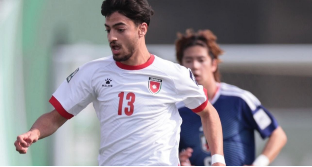
الأخبار - عمان

أنهى المنتخب الوطني لكرة القدم تحت 23 عاماً مشاركته في بطولة كأس آسيا، بعد خسارته أمام نظيره الياباني بركلات الترجيح بنتيجة 4-2، عقب انتهاء الوقتين الأصلي والإضائي بالتعادل 1-1، في اللقاء الذي أقيم عصر الجمعة على الملعب الريديف لاستاد مدينة الملك عبدالله الرياضية في جدة، ضمن منافسات الدور ربع النهائي.