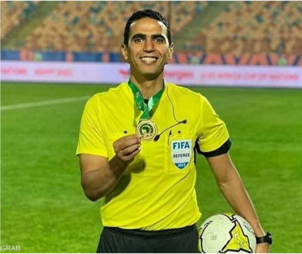
الأخبار - وكالات

حدد الاتحاد الأفريقي لكرة القدم «كاف»، الطاقم التحكيمي الذي سيقود مباراة تحديد المركز الثالث في بطولة كأس أمم أفريقيا، والتي تجمع بين منتخبي مصر ونيجيريا. وعيّن «كاف» الحكم المغربي جلال جيد لإدارة اللقاء، بمساعدة مواطنيه زكرياء برينسي ومصطفى أكركاؤ، فيما سيتولى الجزائري لحلو بنبراهيم إدارة تقنية حكم الفيديو المساعد «فار»، بمساعدة التونسي هيثم قيراط والمغربي حمزة الفارق. وتقام المباراة اليوم، على ملعب محمد الخامس في مدينة الدار البيضاء، عند الساعة الخامسة مساء بتوقيت غرينتش.