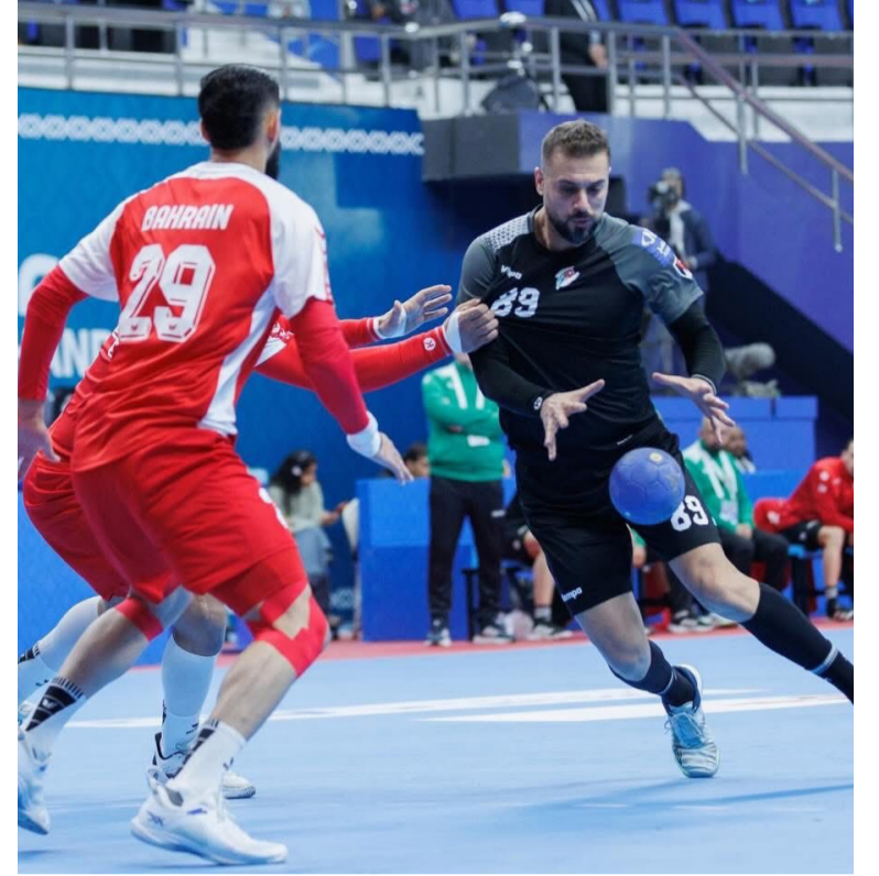
الأخبار - عمان

خسر المنتخب الوطني لكرة اليد للرجال، أمام نظيره البحريني بنتيجة 22-21، في المباراة التي جرت يوم أمس في الكويت، بافتتاح منافسات البطولة الآسيوية.