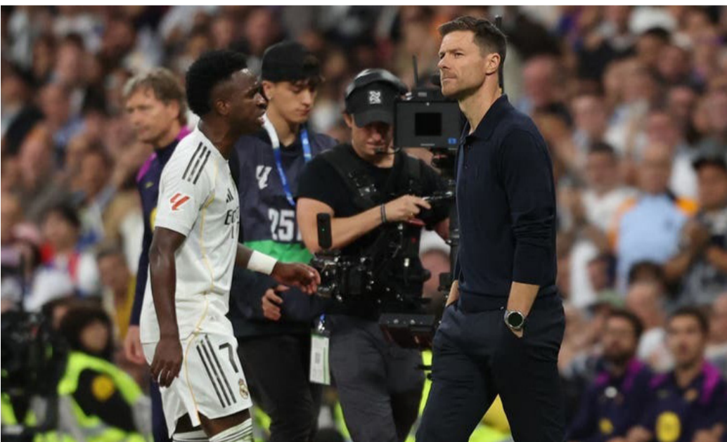
الأخبار - وكالات

اعتبر المدرب الإسباني كيكي فلوريس سانشير المدرب السابق لأتلتيكو مدريد وإشبيلية أن البرازيلي فينيسيوس جونيور سبب الدمار الذي يعيشه ريال مدريد حالي، مشير إلى أن اللاعب البرازيلي لا يمثل «قيم» النادي المدرسي الحريق.