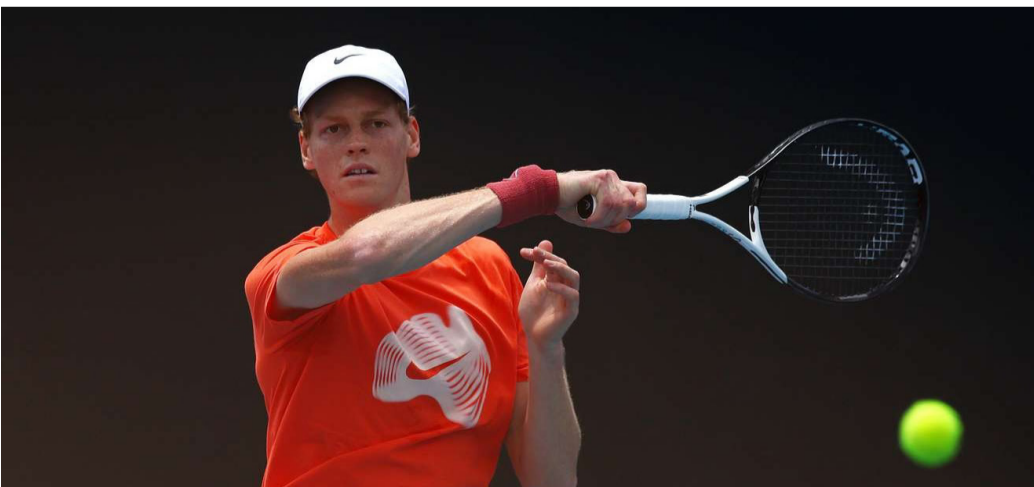
الأخبار - وكالات

بينما يسعى لتحقيق لقبه الثالث على التوالي في أولى بطولات الجراندي سلام للموسم، وهدفه طويل الأمد لاستعادة صدارة التصنيف العالمي من كارلوس ألكاراز، صرح سينر أن التقدم للأمام وتحسين الإرسال كانا من أهم الجوانب التي عمل عليها فريقه خلال فترة التوقف بين الموسمين.