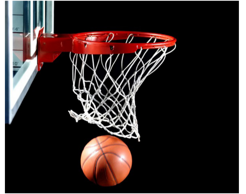
الأخبار - عمان

تغلب فريق الفحيفس على نظيره الأرتوذكسي بنتيجة 80-51، في المباراة التي أقيمت يوم أمس الجمعة ضمن منافسات المرحلة الثالثة من دوري السيدات 2025. وجرت المباراة على صالة الأمير حمزة في مدينة الحسين للشباب، حيث نجح فريق الفحيفس في حسم اللقاء لمصلحته بعد أداء منظم، ليخرج بنقاط كاملة ضمن مشواره في البطولة.