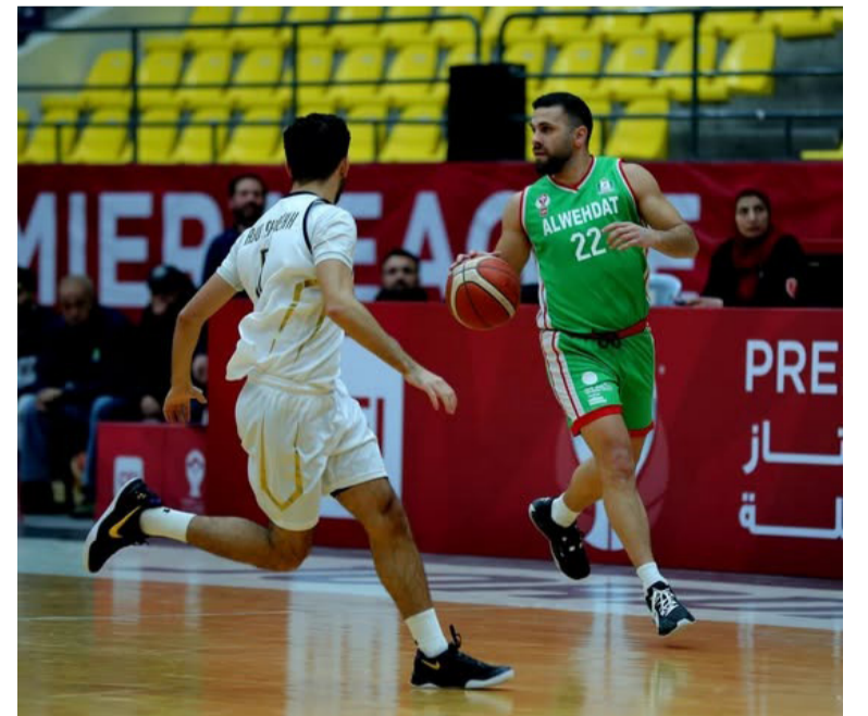
الأخبار - عمان

تغلب فريق الوحدات على نظيره الجبهة بنتيجة 80-74، في المباراة التي أقيمت يوم أمس الجمعة ضمن منافسات الجولة التاسعة من إياب المرحلة الأولى لبطولة دوري CFI الممتاز للرجال بكرة السلة موسم 2025.