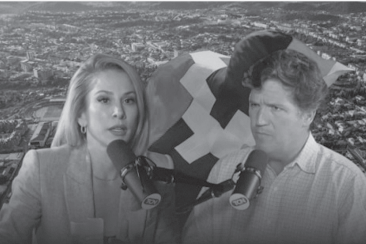
الأبواب - وكالات

ولفت د. علوش إلى أنه «بالنسبة لعلق سياسي، يتناول شؤوناً جدية، ويتخذ مواقف