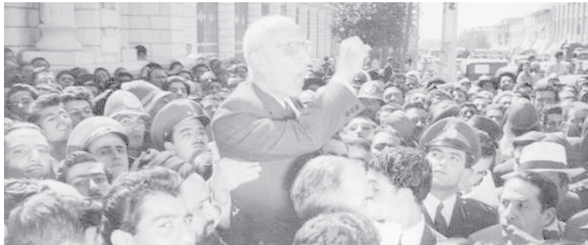
الأبواب - وكالات

معطلة بين الاستجابة للطلب الأميركي أو تجنب خطوة قد تُفسر على أنها مساس بسيادة الدول والقانون الدولي. وخلاف من تداعيات غير محسوبة وتحذر أطراف معارضة لأي تصعيد من أن أي تحرك غير محسوب قد يقود إلى تداعيات إقليمية واسعة، فضلاً عن كلفة إنسانية وسياسية مرتفعة، في ظل استمرار الاحتجاجات وقطع الإنترنت وتشديد القبضة الأمنية داخل إيران.