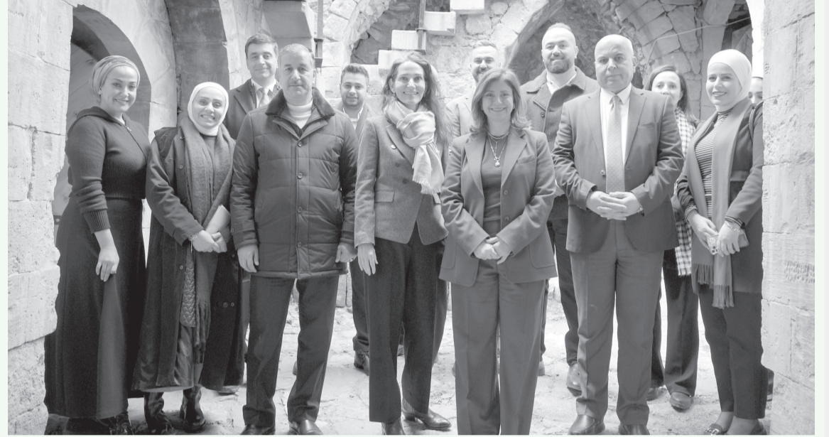
الأنباط - السلط

ويشمل المشروع مجموعة من البرامج الهادفة إلى تعزيز مشاركة المجتمع المحلي من بينها تدريب عملي على مهارات الترميم، وعقد محاضرات في جامعات المملكة حول العلاقة بين التراث الثقافي والتغير المناخي، وبرامج "قادة شباب التراث والمناخ" الذي طوّرتنه الجمعية، إضافة إلى ورشة عمل متخصصة لموظفي البلديات حول التغير المناخي والتراث الثقافي وإدارة الزوار.