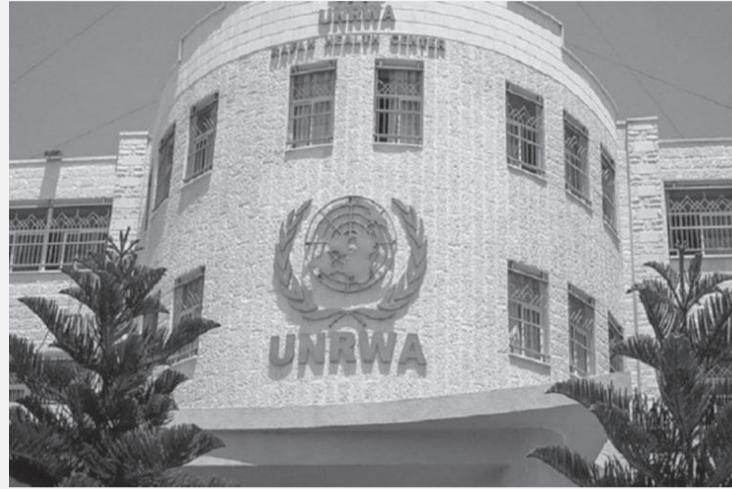
الأبواب - وكالات

التي أقرها الكنيست ضد «أونروا». واعتبر أن هذه الإجراءات تندرج ضمن حملة متواصلة تشنها سلطات الاحتلال الإسرائيلي لمنع الوكالة من تنفيذ ولايتها الممنوحة لها من الجمعية العامة للأمم المتحدة في شرقي القدس، التي لا تقع ضمن السيادة الإسرائيلية. وأكد أن تطبيق القانون الإسرائيلي في القدس الشرقية المحتلة يُعد غير قانوني، لافتاً إلى أن محكمة العدل الدولية كانت قد قضت في تشرين الأول/أكتوبر 2020 بأن إسرائيل ملزمة بتسهيل عمليات الإغاثة التي تقدمها أونروا، إلا أن الإجراءات الحالية تمثل نقیضاً لذلك.