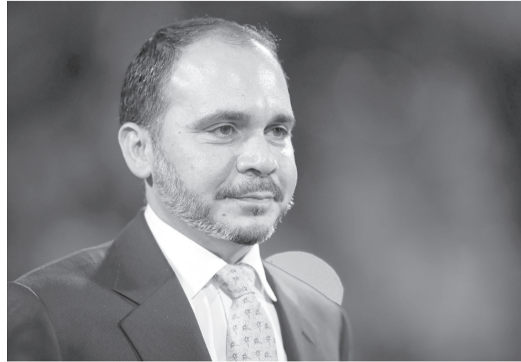
الأناط - عمان

اطمان سمو الأمير علي بن الحسين، رئيس الاتحاد الأردني لكرة القدم، على لاعبي المنتخب الوطني الأولمبي تحت سن ٢٣، قبل مباراتهم أمام منتخب قرغيزستان ببطولة كأس آسيا التي تستضيفها مدينة جدة السعودية. وأجرى سموه الأحد، اتصالاً مع المدير الفني للمنتخب الوطني عمر نجحي واللاعبين، وأشاد بما يقدموه من مجهود. وأثنى المدرب واللاعبون على دعم سمو الأمير لهم ومتابعته لكافة التفاصيل، مؤكداً أن هذا الدعم يحفزهم ويعزز من معنوياتهم لمواصلة السعي لتحقيق الإنجازات.