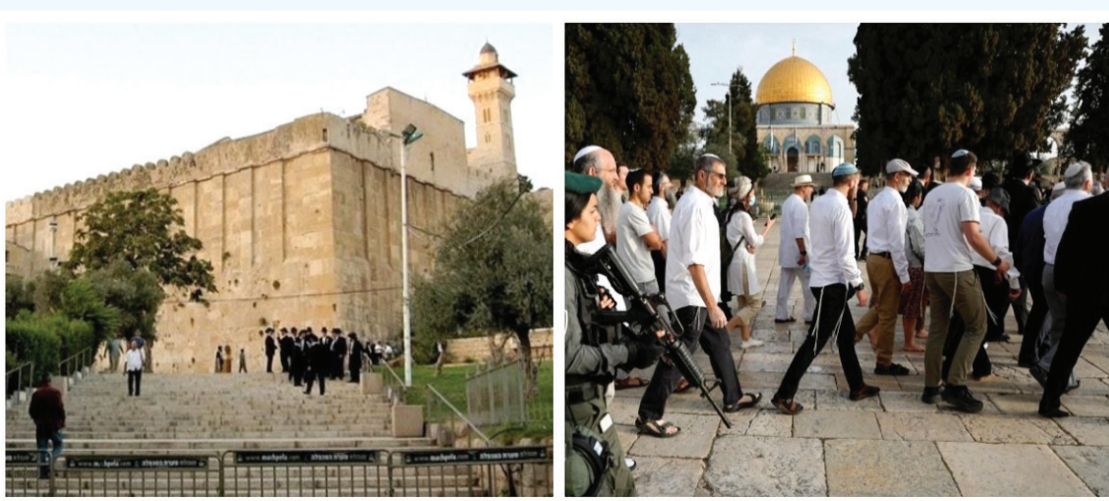
التفاصيل ص « ١٠ »

قالت وزارة الأوقاف والشؤون الدينية، إن المستوطنين بحماية قوات الاحتلال الإسرائيلي اقتحموا المسجد الأقصى المبارك 280 مرة، بينما منع الاحتلال رفع الأذان 769 وقتاً في الحرم الإبراهيمي، خلال عام 2025. وقالت الوزارة في تقريرها السنوي، اليوم الأحد: إن الاحتلال ومنذ مطلع العام الماضي اعتدى على المسجد الأقصى من خلال سماحه لعصابات المستعمرين الإسرائيليين باقتحامه وتدنيس ساحاته ومصاطبه، وذلك لـ (280) مرة، مارس خلالها المستعمرون.