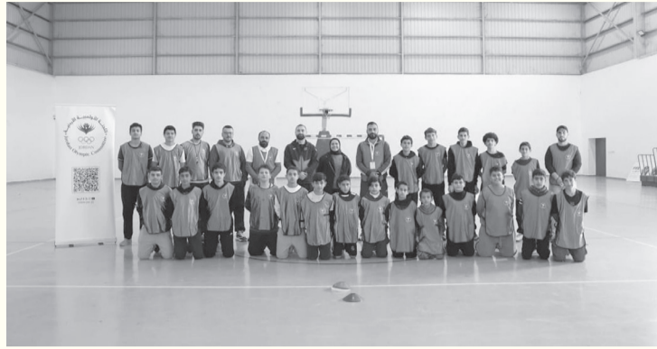
الأناط - عمان

المحلية. ومن المقرر أن يشمل المشروع تنفيذ ٨٠ نشاطاً رياضياً خلال عام ٢٠٢٦، بواقع ٢٠ نشاطاً كل ثلاثة أشهر، موزعة على مختلف محافظات المملكة، وتشمل أنشطة متنوعة تستهدف فئات عمرية مختلفة، وبما يلبي احتياجات المجتمعات المحلية. ويذكر أن اللجنة الأولمبية الأردنية كانت قد اختتمت في وقت سابق سلسلة الدورات التدريبية «قيادة الرياضة المجتمعية»، التي نفذها قسم الرياضة للجميع، ضمن مشروع دعم وتمكين مبادرات الرياضة المجتمعية، والتي هدفت إلى تمكين الشباب والشابات من تصميم وتنفيذ مبادرات رياضية مجتمعية تسهم في التنمية المستدامة ونشر ثقافة الرياضة ك أسلوب حياة.