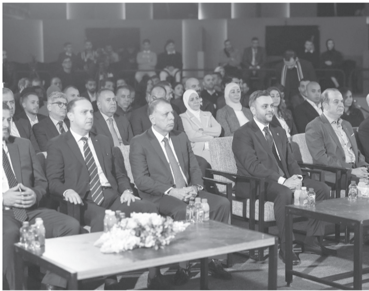
الأناط - عمان

رعى سمو الأمير عمر بن فيصل السبت، حفل تكريم وتوزيع الجوائز لداعمي قطاع الرياضات الإلكترونية لعام ٢٠٢٥، والذي نظمه الاتحاد الأردني للرياضات الإلكترونية تقديراً للجهود المبذولة في دعم وتطوير هذا القطاع الحيوي، وتعزيز حضوره على المستويين المحلي والإقليمي. وقال سموه في كلمته خلال الحفل، إن عام ٢٠٢٥ لم يكن عادياً، بل كان عاماً مليئاً بالتحدي والعمل، عاماً ظهر فيه بطولاتنا وأبطالنا بصورة متميزة، وأثبتوا أن شباب الأردن قادرون على المنافسة والتميز في الرياضات الإلكترونية. وأضاف سموه، وراء هذه النتائج كان هناك عمل متواصل من المدربين والإداريين، ودعم صادق من شركائنا، الذين كانوا جزءاً أساسياً من كل إنجاز تحقق. وتابع سموه قائلاً، إن ما وصلنا إليه اليوم لم يكن صدفة، بل نتيجة تعاون، وثقة، وإيمان حقيقي بشدرات لاعبينا، وعمل جماعي من كل أطراف منظومة الاتحاد. وأكد سموه أن لقاء اليوم للشكر على الجهود والمساهمة في الإنجازات التي تحققت، نتطلع سوياً لتحقيق المزيد منها في