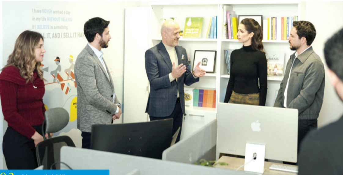
03 الانباط - عمان