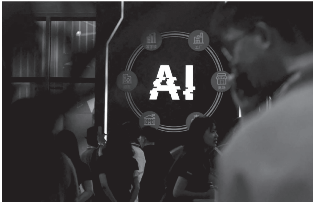
الانبساط - وكالات

أصدرت هيئة الفضاء الإلكتروني الصينية أمس السبت مسودة قواعد لتشديد الرقابة على خدمات الذكاء الاصطناعي المصممة لمحاكاة الشخصيات البشرية والتفاعل العاطفي مع المستخدمين.