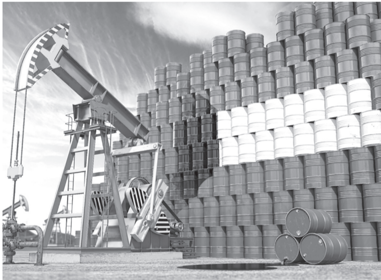
الانبساط - وكالات

انخفض سعر برميل النفط الكويتي ٢١ سنت ليبلغ ٦١,٤٠ دولار للبرميل في تداولات يوم أمس الجمعة، مقابل ٦١,٦١ دولار للبرميل في تداولات يوم الأربعاء الماضي، وفقا لسعر العن من مؤسسة البترول الكويتية. وفي الأسواق العالمية انخفضت العقود الآجلة لخام برنت ١,٦٠ دولار لتبلغ ٦٠,٦٤ دولار للبرميل، كما انخفضت العقود الآجلة لخام غرب تكساس الوسيط الأميركي ١,٦١ دولار لتبلغ ٥٦,٧٤ دولار.