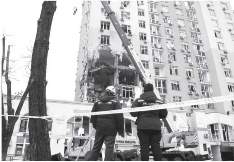
الانبساط - وكالات

تسلط جولة الصحافة امس السبت، الضوء على تحذير موجه للدول الغربية بشأن المستقبل على إثر الحرب في أوكرانيا، وأبعاد، وأمر الرئيس الأمريكي بضرب تنظيم الدولة الإسلامية في أفريقيا، إضافة إلى خمسة أسباب تدعو إلى التفاؤل، بشأن الاقتصاد في العام المقبل.