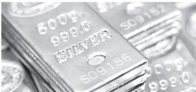
الانبساط - وكالات

ارتفعت الفضة بنسبة تسعة بالمئة لتسجل مستوى قياسيا جديدا عند ٧٨,٥٣ دولارا للأوقية (الأونصة)، الجمعة، مدعومة بعوامل عدة منها نقص المعروض وزيادة الطلب الصناعي.