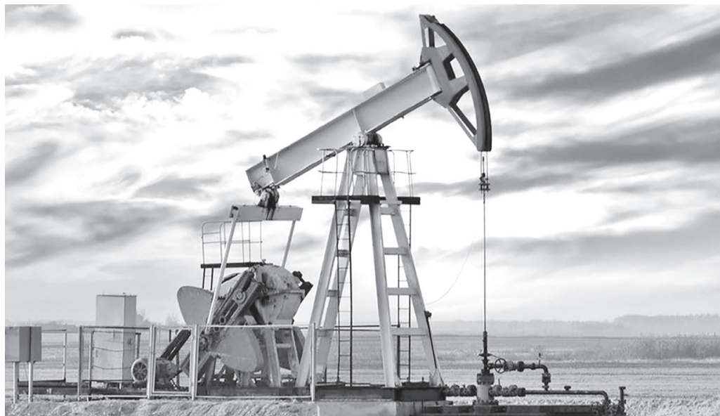
الانبساط - وكالات

هبطت أسعار النفط أكثر من ٢٪ عند التسوية في جلسة مساء الجمعة، مع تقييم المستثمرين تخمة محتملة في المعروض وانخفاض علاوة مخاطر الحرب، فضلا عن تقرب احتمال التوصل إلى اتفاق سلام في أوكرانيا مطلع الأسبوع المقبل بين الرئيس الأوكراني فولوديمير زيلينسكي ونظيره الأميركي دونالد ترامب.