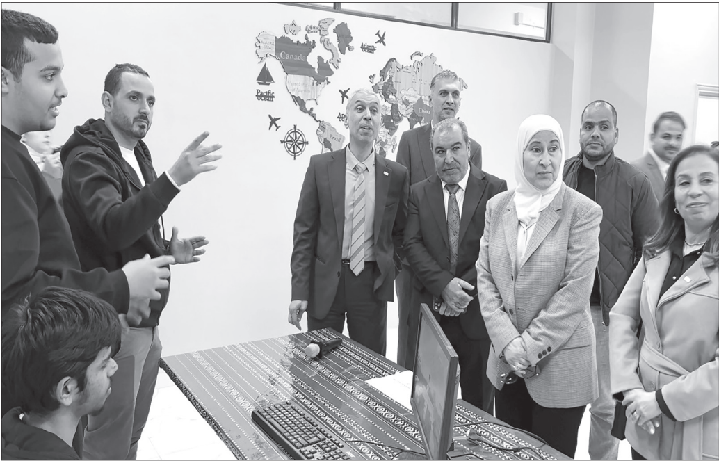
الإيجابي في المجتمع.

وتخلل الفعالية جلسة نقاشية تفاعلية جمعت الطلبة والعلمين والضيوف، جرى خلالها تبادل الآراء حول أهمية المشاريع البيئية المروضة، وسبل تطويرها لتصبح نماذج قابلة للتطبيق على نطاق أوسع، بما يخدم أهداف الاستدامة والحد من آثار التغير المناخي.