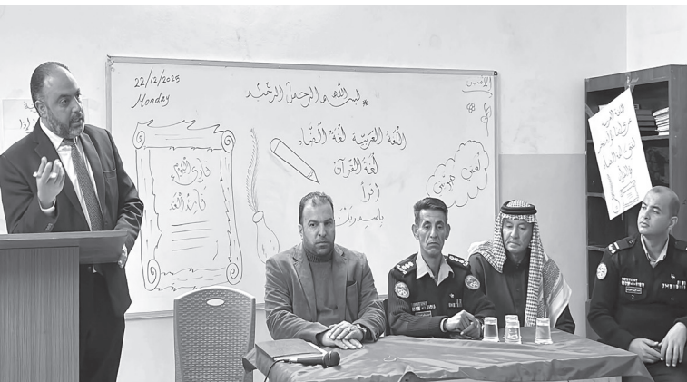
الانباط - الزرقاء

احتفل منتدى الهاشمية الثقافي، بالتعاون مع مجمع اللغة العربية الأردني، أمس الاثنين، مناسبة اليوم العالمي للغة العربية تحت شعار «مسارات مبتكرة للغة العربية: سياسات وممارسات من أجل مستقبل لغوي أكثر شمولاً».