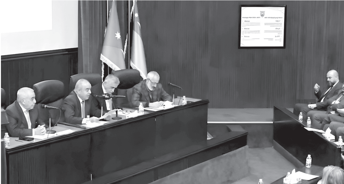
الانباط - عمّان

بحثت اللجنة المشتركة لمنظومة تحديث التعليم العالي في مجلس الأعيان، التي تضم ٩ لجان، خلال اجتماع اليوم الأحد في الجامعة الأردنية برئاسة الدكتور مصطفى الحمارة، مسارات التحديث وآليات تطوير منظومة التعليم العالي. وقال العين الحمارة إن الهدف من مسار التحديث يتمثل بضمان جودة مخرجات التعليم العالي، وتوطين مشروع التحديث داخل الجامعات، وبناء شراكات فاعلة، وتعزيز التشبيك مع مختلف الجامعات ومؤسسات المجتمع ذات العلاقة. من جانبه، أكد وزير التربية والتعليم والتعليم العالي والبحث العلمي الدكتور عزمي محافظة، أن اللقاء يهدف إلى تقديم رؤية شاملة للتعليم العالي في الأردن.