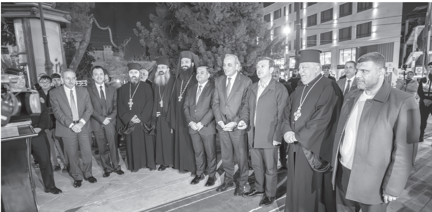
الانباط - عمّان