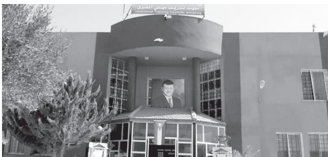
الانباط - عمّان