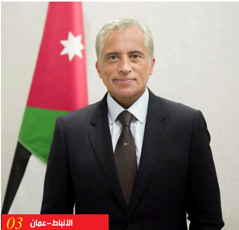
الانباط - عمان 03

الذي ستطلقه الحكومة خلال الأسابيع المقبلة. وأكد رئيس الوزراء أن الحكومة تلتزم من خلال الموازنة، بالمسار المالي والاقتصادي الذي بدأته، والقائم على الانضباط المالي، وتحفيز النمو، وحماية الفئات الأكثر حاجة وذوي الدخل المحدود. وقال «نمضي بثقة في تنفيذ المشاريع الاستراتيجية الكبرى والمهمة لمستقبلنا، في قطاعات المياه والطاقة والتّقل والسّكك الحديدية والبنى التحتية وغيرها؛ لنبدأ تنفيذها العام المقبل؛ لتشكل رافعة أساسية للنمو الاقتصادي، وتوفّر فرص التّشغيل لأبنائنا وبناتنا، إلى جانب تحسين مستوى الخدمات المقدّمة للمواطنين في مختلف محافظات المملكة». كما أكد رئيس الوزراء التزام الحكومة بالعمل الدؤوب لزيادة معدلات النمو الاقتصادي تدريجياً، وصولاً إلى تحقيق نمو بنسبة تصل إلى ٤٪ مع نهاية عام ٢٠٢٨، من خلال تسريع تنفيذ المشاريع الكبرى،