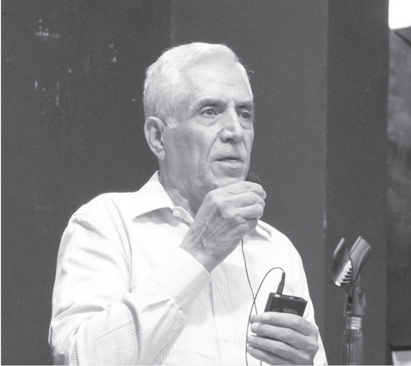
الأنباط - عمر الخطيب

لأعوام طويلة كان اسم د.زهير الصادق يستدعى كلما فتح ملف الغاز والنفط في الأردن لا ب وصفه خبيراً يستمع إليه وإنما باعتباره (في نظر خصومه) صاحب «خزعبلات، أو مروج أوهام أو متفائل أكثر مما ينبغي في بلد اعتاد أن يسمع بأن أرضه فقيرة وباطنها صامت.