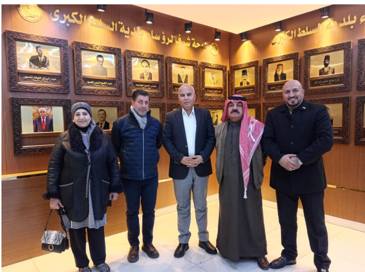
الأنباط - زيد عوامله

على المال العام وصون المظهر الحضاري للمدينة. وفي سياق متصل أعلن البطاينة عن تكثيف عمليات المراقبة والمتابعة الميدانية على المقابر، في مدينة السلط الكبرى ومناطقها بالتعاون مع مديرية أوقاف محافظة البلقاء وذلك لضبط أي مخالفات أو تجاوزات ومنع أي اعتداءات قد تحدث فيها حفاظاً على حرمة الأموات ومشاعر ذويهم. وشدد البطاينة على أن البلدية لن تتهاون في تطبيق النظام وستعمل بالتعاون مع الجهات المعنية على ضمان الالتزام الكامل بالضوابط والقوانين في هذا الشأن. من جانبهم أعرب أعضاء المجلس المحلي