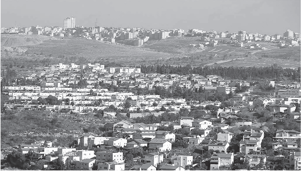
ومنذ بداية ولاية الحكومة الإسرائيلية الحالية، تمت الموافقة على ما مجموعه ٥١٣٧٠ وحدة سكنية جديدة