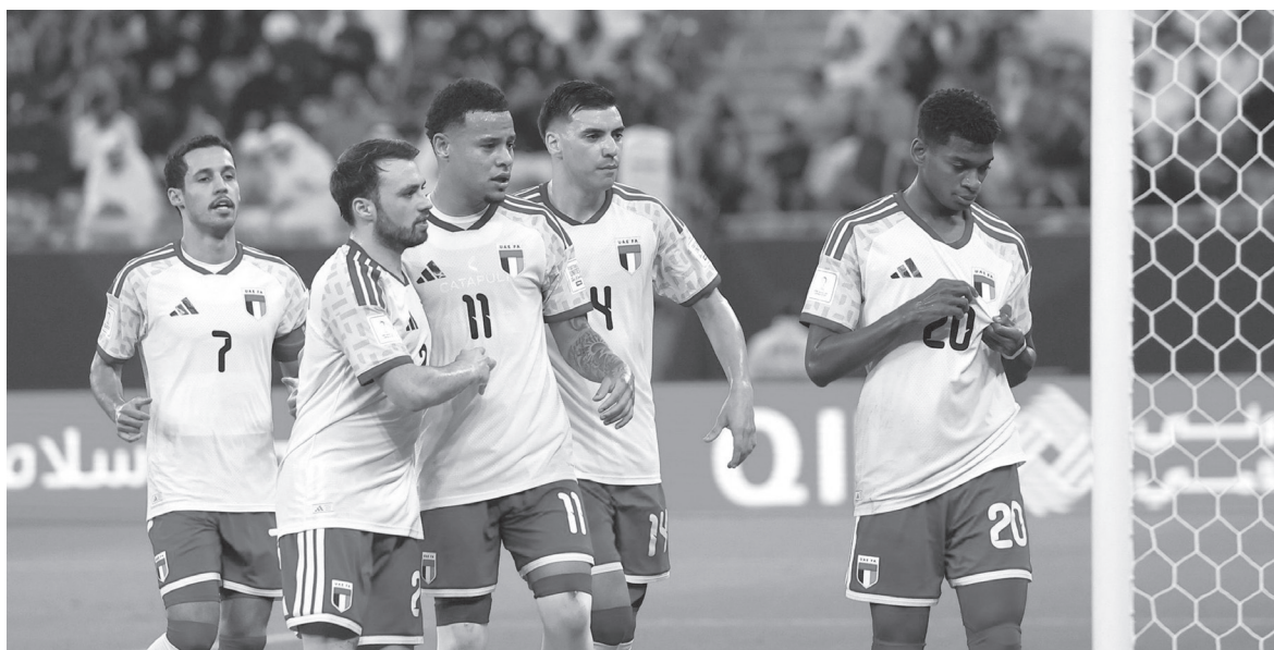
الألباط - مينا بنى ياسين

قطع المنتخب الأردني خطوة كبيرة ومشرفة في بطولة كأس العرب ٢٠٢٥ بعدما حقق فوزاً عريضاً على المنتخب المصري بثلاثية نظيفة، أداء ونتيجة في مباراة أكدت تطور شخصية النشامى وقدرتهم على المنافسة بثقة عالية ودخل المنتخب الأردني اللقاء بروح مصممة على حسم بطاقة التأهل، فظهر ذلك في انضباط الخط الخلفي، وتحركات الأطراف والضغط العالي الذي أربك المنتخب المصري في فترات مهمة، ليعكس الفريق جاهزيته الفنية والدنية قبل الدور ربع النهائي. ومع تقدم المباراة إلى منتصف