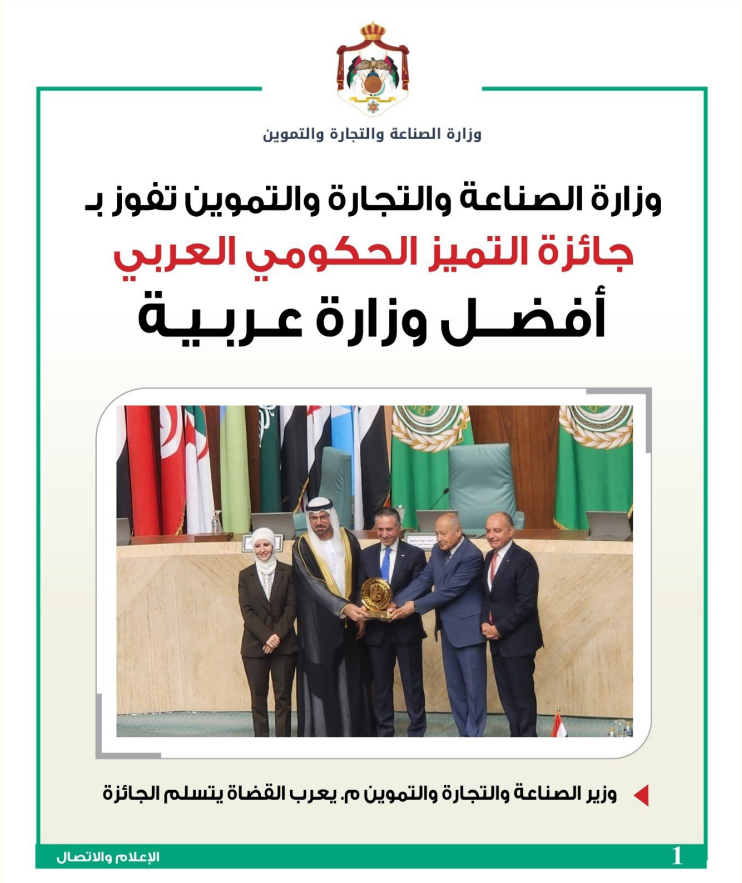
١ الإعلام والاتصال

وأطلق المبادرات الهامة والاستراتيجية محليا وخارجيا وتعزيز الشراكة الاقتصادية الخارجية. كما تضطلع الوزارة بدور محوري في تعزيز الأمن الغذائي للمملكة وإدارة المخزون الاستراتيجي من مادتَي القمح والشعير وتحقيق عدالة المنافسة في السوق المحلي وحماية المستهلكين.