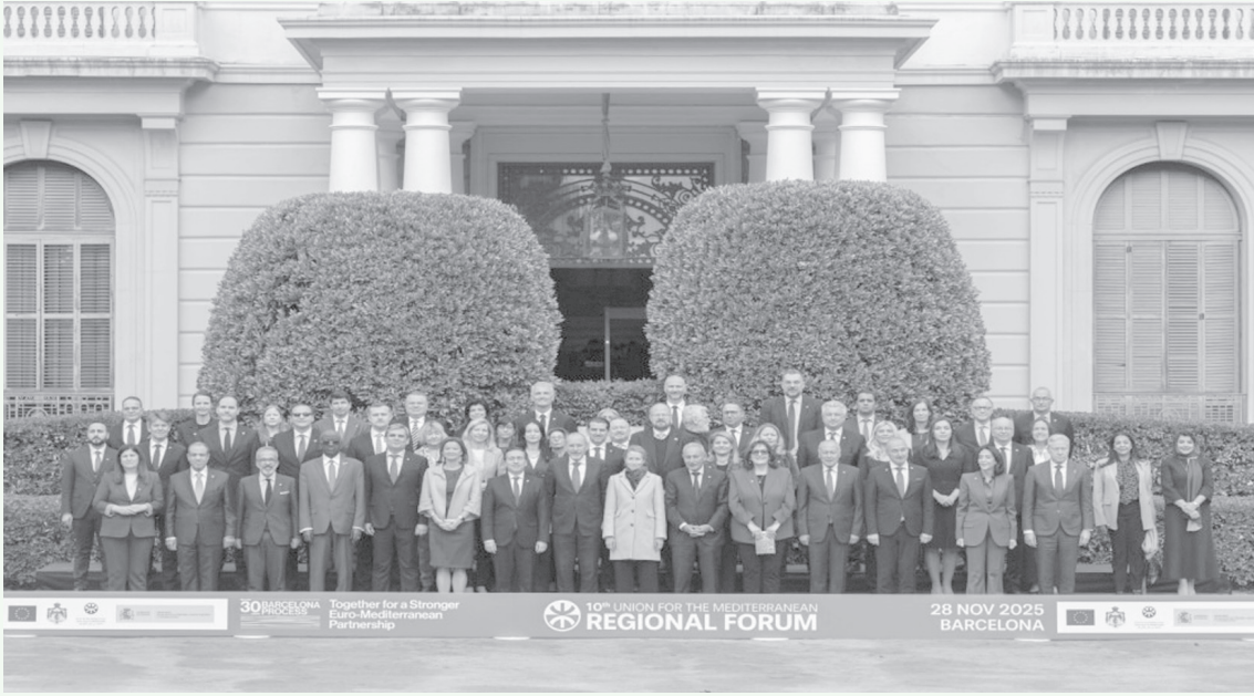
الأنباط - برشلونة

والمسيحية في القدس، وأهمية الوصاية الهاشمية على هذه المقدسات.