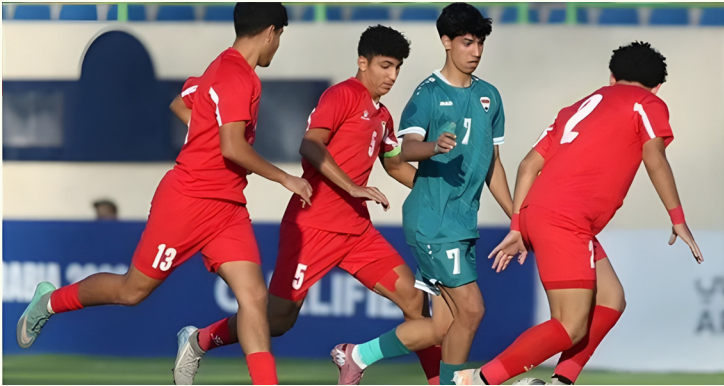
الأنياب - عمان

تعادل المنتخب الوطني للناشئين تحت سن ١٧ لكرة القدم، مع نظيره العراقي بنتيجة ٢-٢، في المباراة التي جرت الأربعاء، على ملعب تطوير العقبة، في إطار منافسات التصفيات الآسيوية. وكان المنتخب حقق الفوز في المباراة الأولى على منتخب بوتان بنتيجة ٥-٠، وخسر في الثانية أمام أستراليا بنتيجة ١-٠، قبل أن يتعادل اليوم مع العراق. ويختم المنتخب مشواره في التصفيات بمواجهة الفلبين يوم الأحد المقبل على ملعب العقبة. ويشارك في التصفيات ٣٨ منتخبا تم توزيعهم على ٧ مجموعات تقام بنظام التجمع، ويتأهل إلى النهائيات الآسيوية التي تقام خلال الفترة من ٧ إلى ٢٤ أيار ٢٠٢٦، في السعودية، صاحب المركز الأول من كل مجموعة، لينضموا إلى تسعة منتخبات سبق أن ضمنّت تأهلها تلقائيا من خلال تأهلها إلى كأس العالم للناشئين تحت ١٧ عاما ٢٠٢٥.