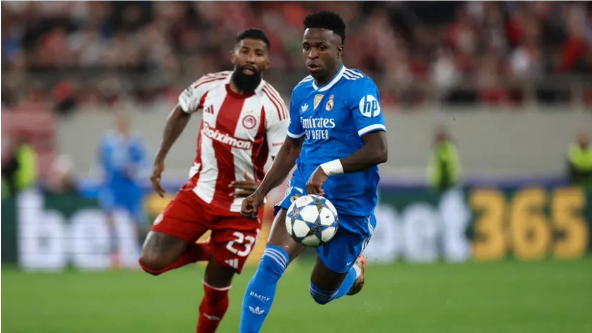
الأنياب - وكالات

يبدو أن فينيسيوس جونيور قد وافق على عرض ريال مدريد لتجديد عقده مقابل تخفيض مطالبه، بعدما كان يرغب براتب يعادل أو يفوق ما يتقاضاه كيليان مبابي. ينتهي عقد اللاعب البرازيلي في ٣٠ يونيو ٢٠٢٧، ويتقاضى حالياً ١٥ مليون يورو إجمالياً في الموسم، وفق ما نشرته صحيفة mundo deportivo.