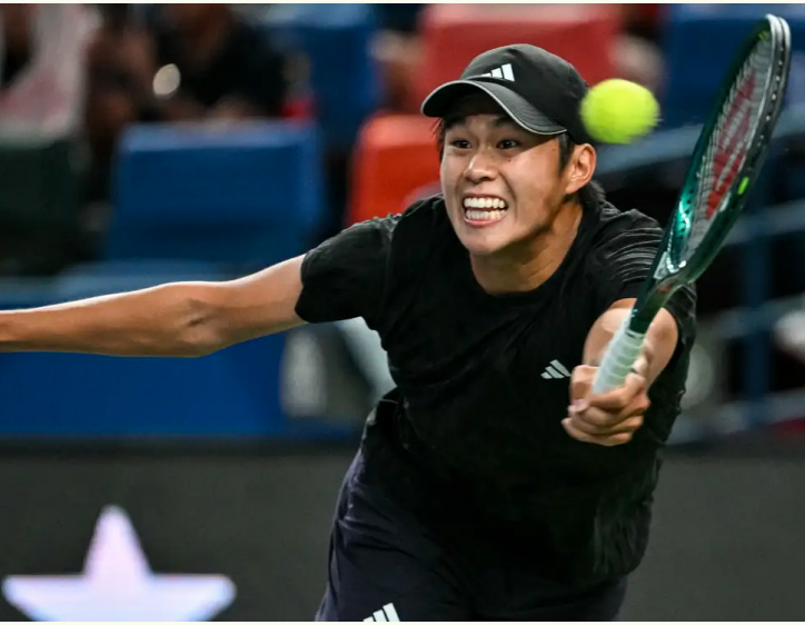
الأنياب - وكالات

عاد الأمريكي ليرنر تين إلى بطولة نهائيات الجيل القادم لرابطة محترفي التنس التي ستقام في جدة بالملكة العربية السعودية الشهر المقبل. وضمن اللاعب البالغ من العمر ١٩ عاما مقعده بعد موسم أول كامل متميز له في الجولة العالمية.