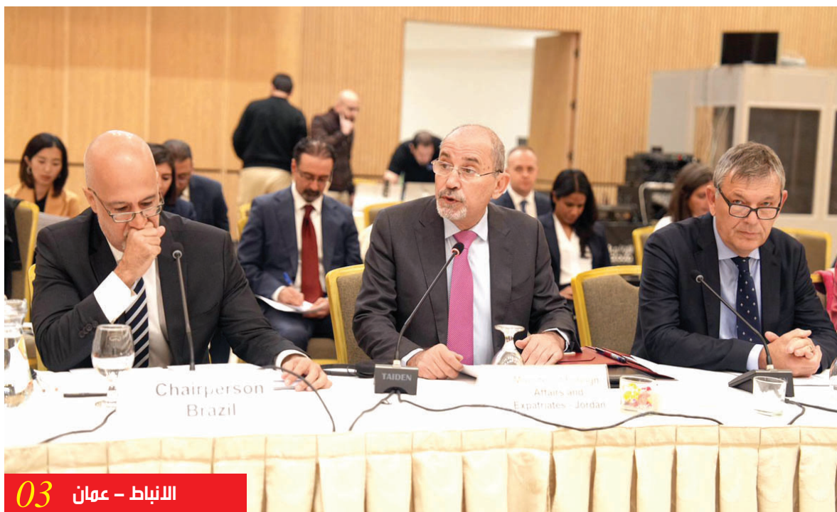
الأنباط - عمان 03

بحث تعزيز التعاون الأردني البحريني في مختلف المجالات