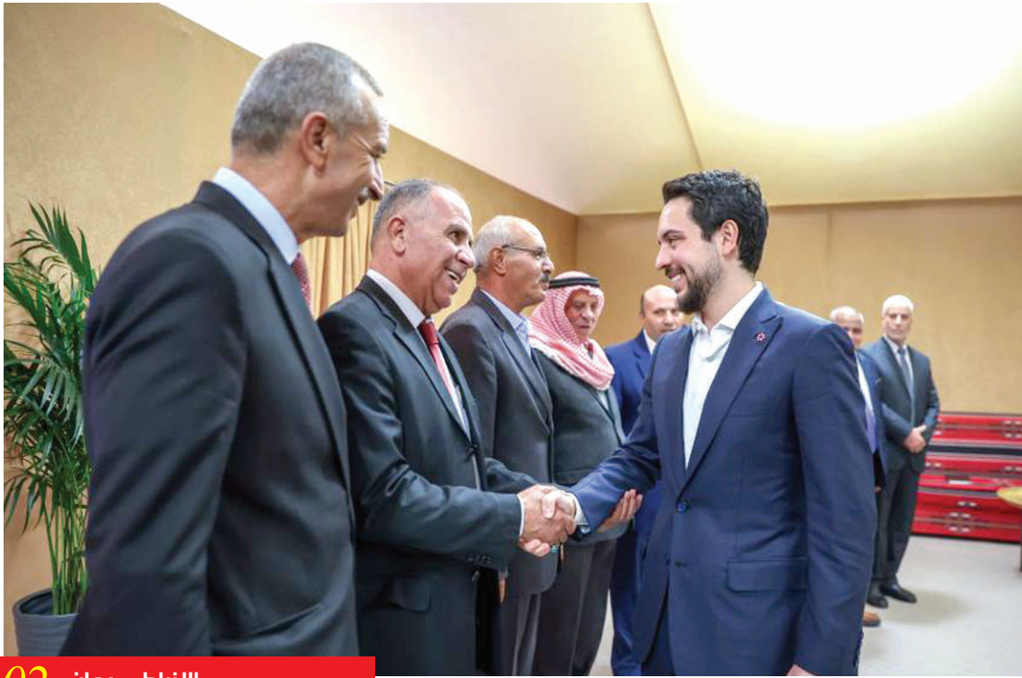
الأنباط - عمان 02

الأردن يدين محاولات الكنيست استهداف الأونروا وحقوق اللاجئين